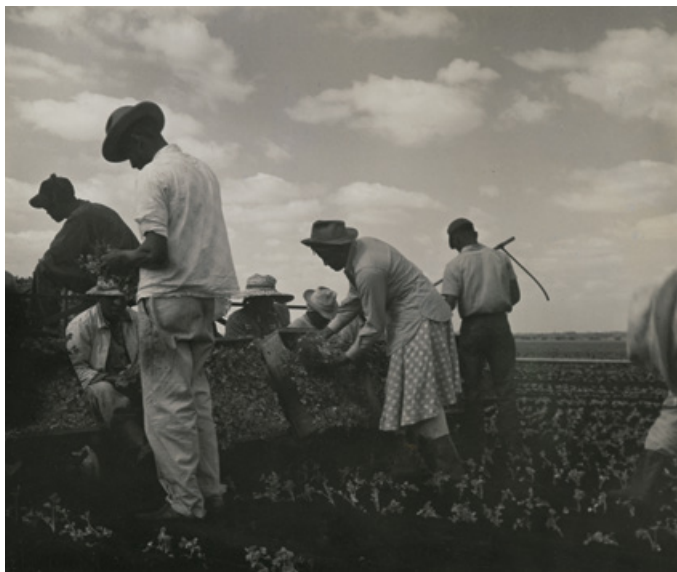
Tennessee, 1950. Brooklyn Museum, donació de Wallace B. Putnam, del Estate of Consuelo Kanaga, 82.65.92

Consuelo Kanaga: copsar l'esperit repassa per primer cop a Espanya i a Europa el conjunt de la trajectòria d'aquesta fotogràfica estatunidenca. L'artista està considerada una figura fonamental de la història de la fotografia contemporània, tant per la seva contribució al reconeixement de la dona en aquest àmbit com per la intensitat amb què les seves imatges enfronten l'espectador a algunes de les grans qüestions socials del nostre temps, en especial la situació de la població afroamericana als Estats Units.