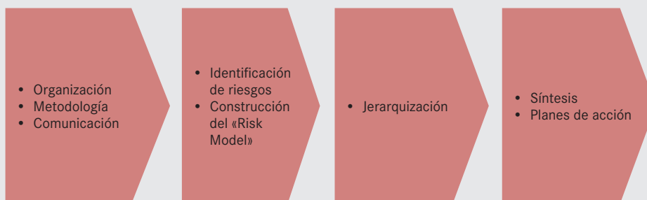
FIGURA 2. ETAPAS DEL ESTUDIO DE MAPA DE RIESGOS

Como ya se ha dicho, con frecuencia se aplican en muchos grupos los métodos de autoevaluación, porque los responsables que están en contacto diario con los riesgos son, sin duda, los mejor situados para, por una parte, identificar las amenazas y, por otra, para jerarquizarlas. Este método asegura además una buena valoración de los resultados. Por supuesto, el trabajo de estos responsables debe facilitarse mediante una preparación minuciosa de un grupo del proyecto y mediante un análisis de los objetivos parciales logrados («benchmarking»). Estos métodos de autoevaluación son los más utilizados por distintas razones: