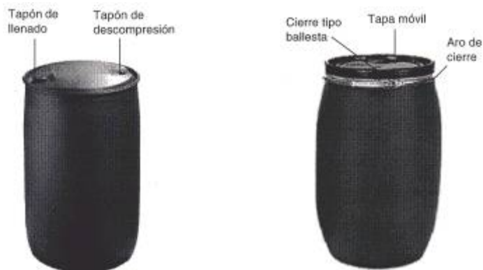
Fig. 1: Bidón de plástico Fig. 2: Bidón de plástico de tapa móvil