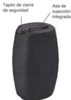
Fig. 3: Jerricán de plástico de tapa fija