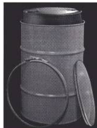
Fig. 5: Envase compuesto de acero y plástico de tapa móvil