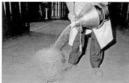
Fig. 2: Ebullición del nitrógeno a presión atmosférica

Las quemaduras que se producen tienen efectos semejantes a las producidas por el calor, si bien presentan una apariencia poco espectacular y poco inquietante al principio, ya que los tejidos helados son poco dolorosos, presentando un aspecto amarillento. Cuando posteriormente se deshuelan se vuelven muy dolorosos y propensos a la infección.