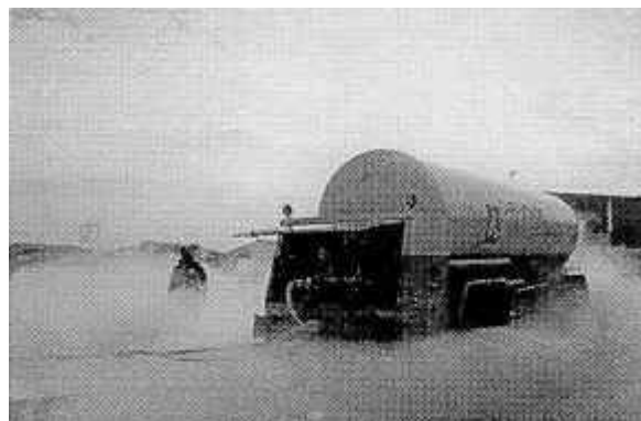
Fig. 4: Nube producida por la vaporización de un gas licuado

En el caso particular del caucho, si el escape tiene lugar en las proximidades de un vehículo figura 4) puede afectar a los neumáticos, los cuales al helarse quedan adheridos al suelo, se vuelven duros y frágiles.