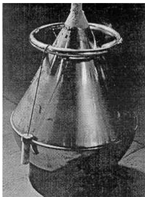
Fig. 5: Depósito tipo Dewar