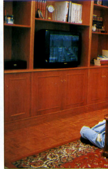
La formación vial trasciende el ámbito de la e