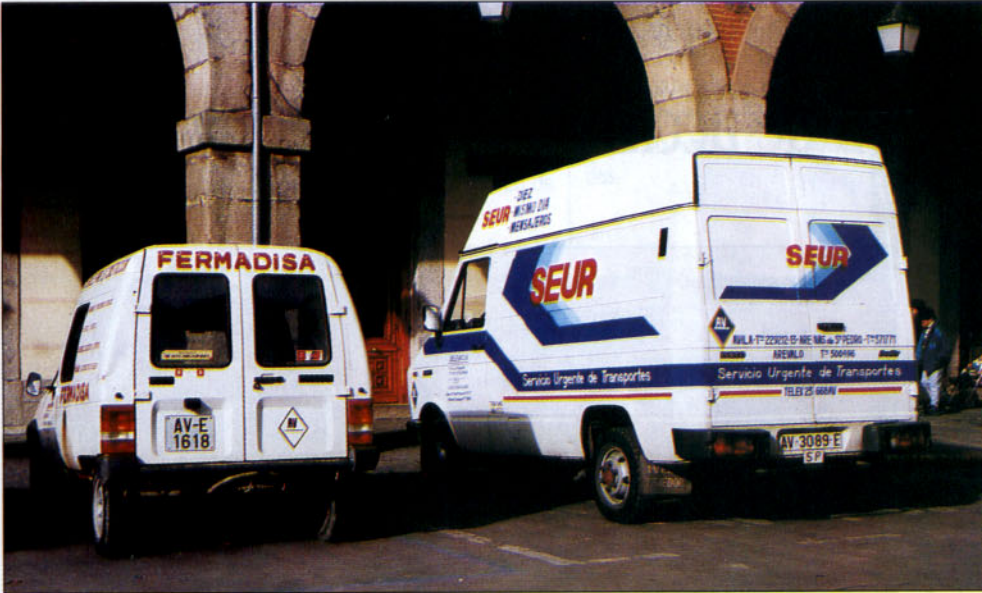
Los vehículos de empresa también son objetivos del programa de seguridad vial.