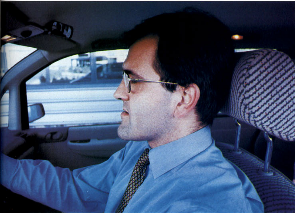
El reposacabezas bien situado evita o reduce las lesiones cervicales.