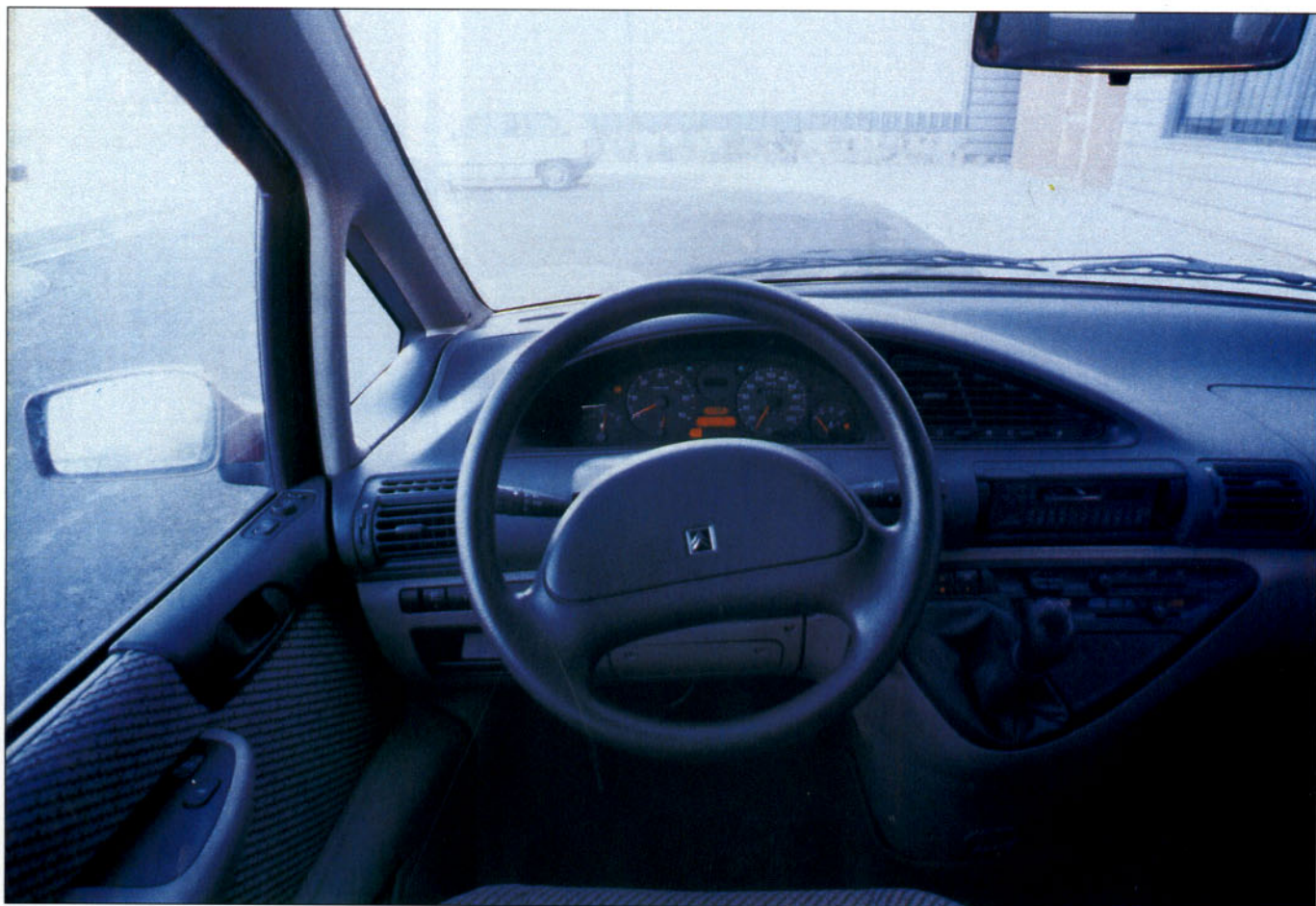
El cuadro de mandos proporciona informaciones que facilita la conducción.

Los reposacabezas pueden ser eficaces para evitar lesiones en el cuello en impactos, sobre todo traseros.