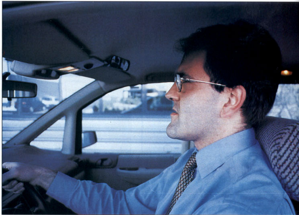
Un reposacabezas mal situado no protege, incluso puede agravar las lesiones cervicales.

En su parte posterior, el respaldo debe recuperar la vertical para servir de apoyo a los hombros. La postura correcta de la cabeza debe ser aproximadamente de 15° con respecto a la vertical. En caso de aceleración o desaceleración fuerte, puede desplazarse bruscamente hacia atrás, por lo que los asientos deben tener su reposacabezas móvil en su parte superior.