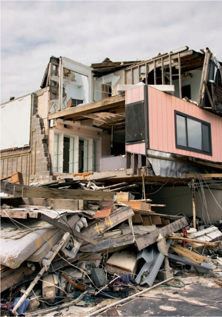
Se tiende a una mayor inversión en seguro de Hogar en las zonas que sufren o han sufrido con periodicidad daños catastróficos. Debajo, el seguro de continente se exige en la mayoría de los contratos de créditos hipotecarios.