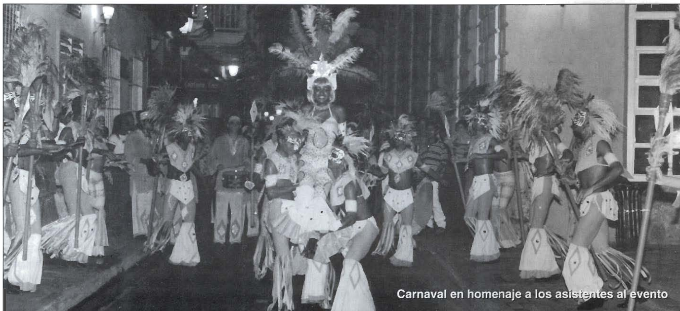
Carnaval en homenaje a los asistentes al evento

Felicitó a Fasecolda por propiciar la discusión de asuntos importantes para el país, desde la perspectiva de un problema de fondo, como es el de la verdadera paz y reconciliación. 6