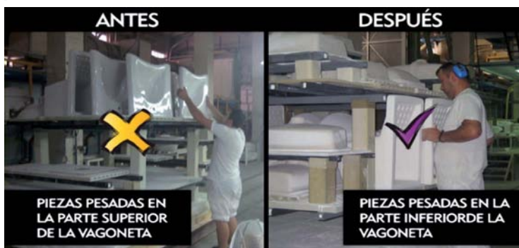
Figura 2 ■ Cambio en el equipo y método de trabajo para eliminar la manipulación de cargas con los brazos por encima de los hombros. Empresa de elaboración de productos cerámicos

Programa de ergonomía participativa en empresas de la Comunidad Valenciana, 2010-2011.