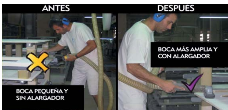
Figura 3 ■ Cambio en una herramienta de trabajo para mejorar la postura y reducir la repetición de movimientos. Empresa de elaboración de productos cerámicos

Programa de ergonomía participativa en empresas de la Comunidad Valenciana, 2010-2011.