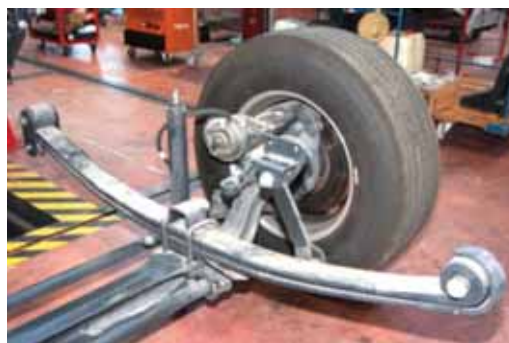
▶ Conjunto eje delantero