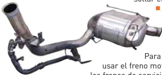
► Bloque catalizador y filtro de partículas

■ Lane Departure Warning System : detecta la salida del carril de circulación mediante un dispositivo en el parabrisas. Si no hay marcado de intermitencia lo advierte acústicamente.