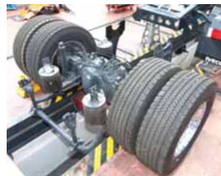
▶ Conjunto puente trasero

El amoníaco se forma al pulverizar un aditivo, denominado comercialmente ADBLUE (Urea) en los gases de escape, para lo que es necesario un depósito de aditivo (1), un equipo de bombeo (2) y el inyector (3) en el conducto de escape.