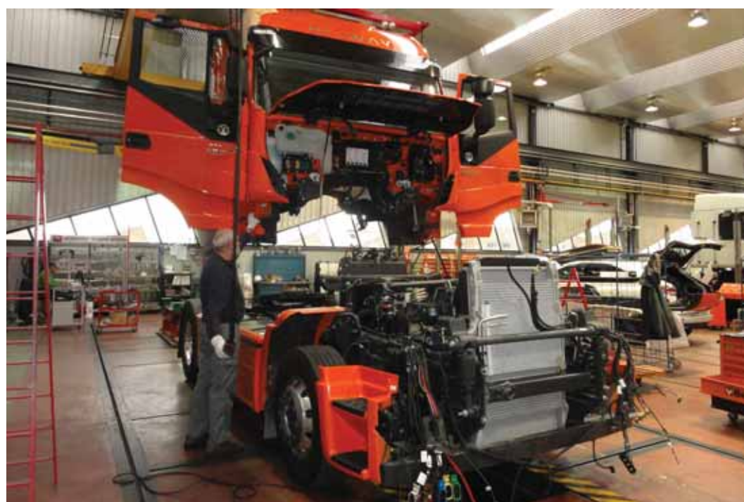
► Desmontaje de cabina

■ Iveconnect Fleet : esta aplicación para profesionales y flotas permite comunicar