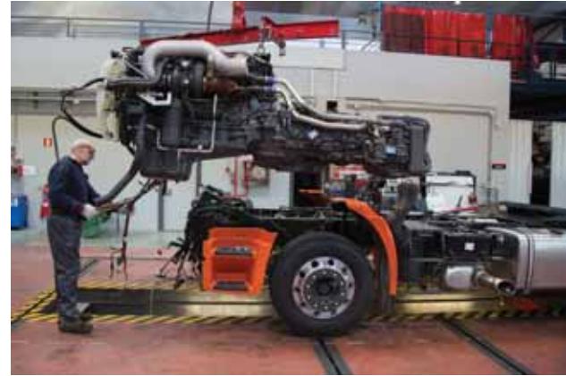
▶ Desmontaje del grupo moto-propulsor