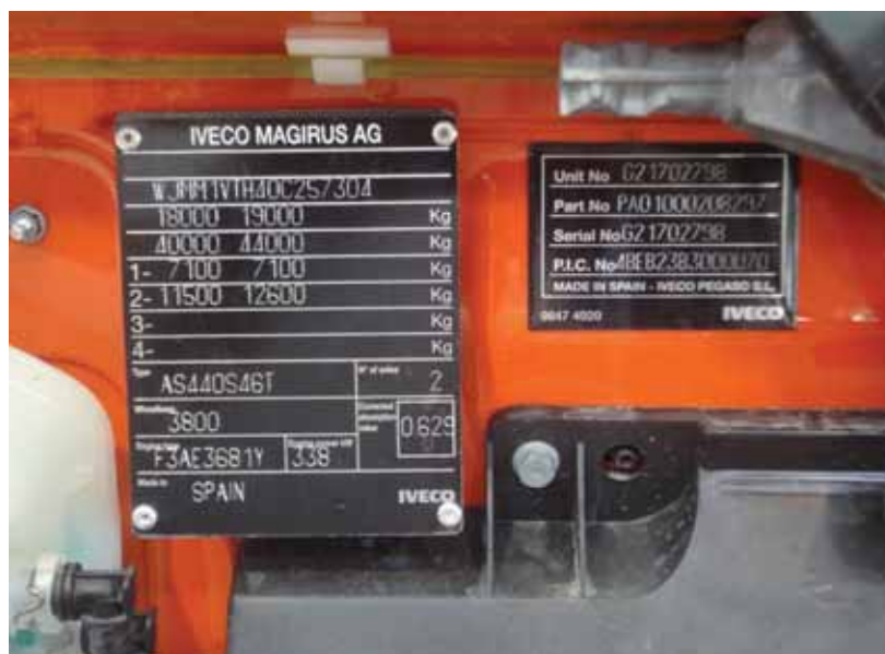
► Identificación en el panel del frente de cabina

obtención de tiempos de reparación y sustitución de elementos, características de construcción, materiales empleados, espesores de las piezas, métodos de unión... Los técnicos de CESVIMAP han trabajado intensamente en este modelo Iveco analizándolo por completo. Han extraído los tiempos de las operaciones , descubriendo qué elementos desmontar para llegar al objeto de estudio, registrando el tipo de unión –soldadura por puntos de resistencia, cordones de soldadura MIG, adhesivo estructural...–, número de puntos de soldadura y longitud de las uniones. Así, se han identificado todos los elementos que configuran el vehículo: número de piezas que lo forman, su comercialización y coste, los tiempos empleados en su reparación, desmontajes y sustituciones.