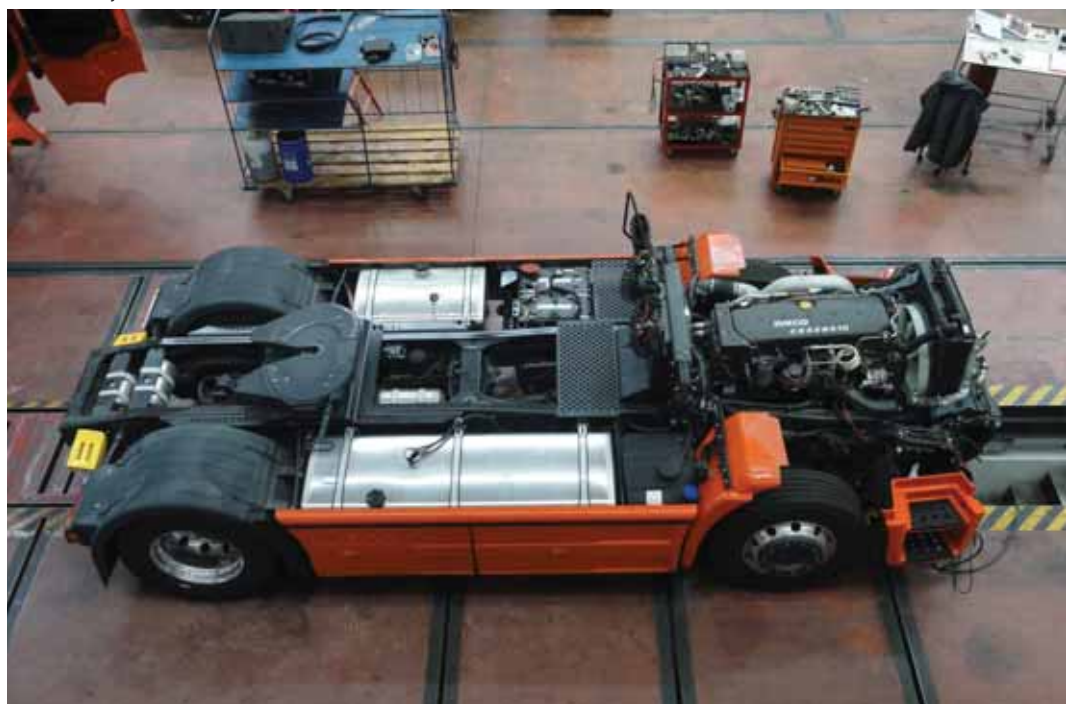
► El Hi-Way en CESVIMAP