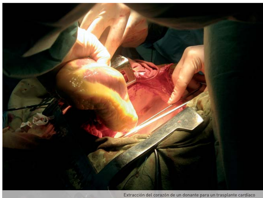
Extracción del corazón de un donante para un trasplante cardíaco