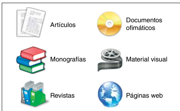
Figura 6. Iconos utilizados en el listado de resultados para identificar el tipo de documento

El acceso a los documentos originales sólo será posible en los casos especificados en el punto Documentos accesibles del apartado 1 de esta NTP.