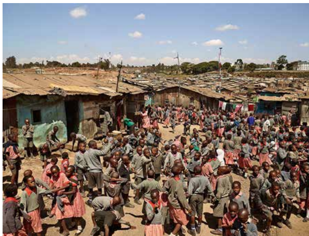
Colegio Valley View. Mathare Nairobi. Kenia. En este colegio hay 815 alumnos y 23 profesores.

Se puede acceder a un resumen de la exposición en este enlace y se pueden ver las 40 fotografías del trabajo en este otro enlace .