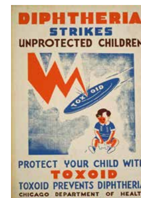
Carteles antiguos de Campañas de Vacunación contra la difteria en Buenos Aires y Chicago.