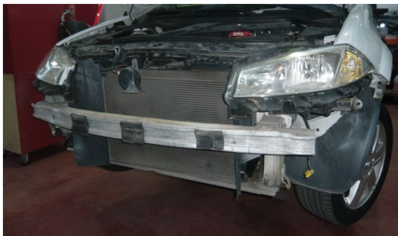
► Desmontaje del paragolpes delantero, previo al del faro

etc.) y, además, valorar que la sustracción se efectúa en la calle.