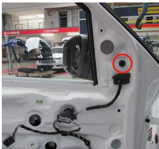
► Sujeción del espejo retrovisor