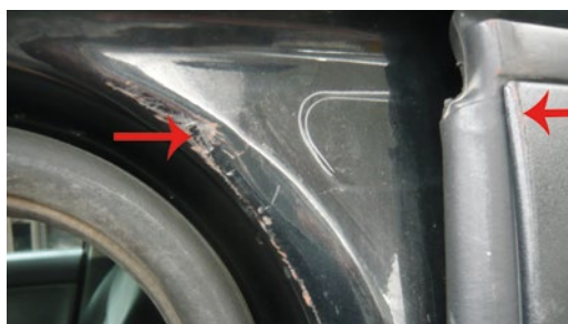
► Marcas dejadas en el interior de la puerta y puerta trasera