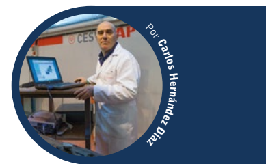
Por Carlos Hernández Díaz

El robo de piezas del vehículo implica su desmontaje por medios violentos o siguiendo el proceso de desmontaje de la pieza. Por medios violentos puede quedar la pieza inutilizada para su reutilización en otro vehículo o que la acción de fuerza deje marcas y vestigios en las piezas colindantes. Sin embargo, siguiendo el proceso de desmontaje, se consigue