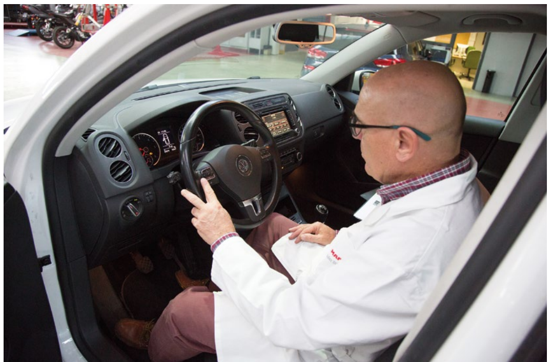
► Verificación de las opciones y accesorios