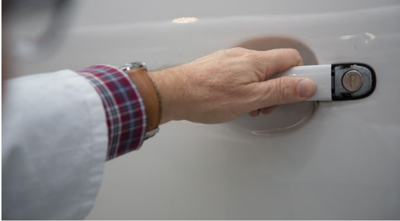
► Ausencia de daños de chapa y pintura