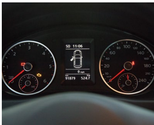
► Fotografía de los kilómetros completados