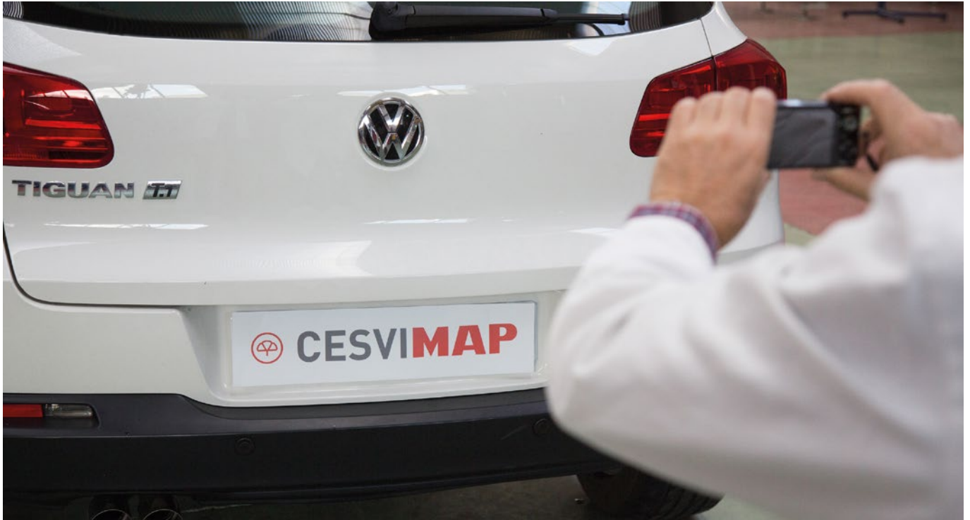
► Ausencia de daños de chapa y pintura

perito que, desde su criterio, indique qué coberturas se podrían asegurar, en vista de los daños del vehículo; no obstante, a él no le corresponde tomar la decisión de la cobertura de seguro que finalmente se vaya a asegurar.