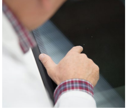
► Revisión de la luna parabrisas del vehículo

informar a la compañía de seguros de si el vehículo presenta rozaduras, abollones o desperfectos en la carrocería, en la pintura o en elementos como faros, pilotos, embellecedores, tapizados, etc. o, incluso, indicar si le falta algún elemento. En consecuencia, debe indicar qué elementos están afectados y el valor de la reparación de los daños que presenten, adjuntando un reportaje fotográfico de los mismos. En este apartado, también hay que indicar la relación de los accesorios que lleva el coche, distinguiendo cuáles son de serie o de opción y, en este último caso, el valor de los extras que monta. Esto requerirá un estudio pormenorizado sobre el modelo, la