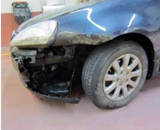
▶ Parte del paragolpes al que le falta un trozo