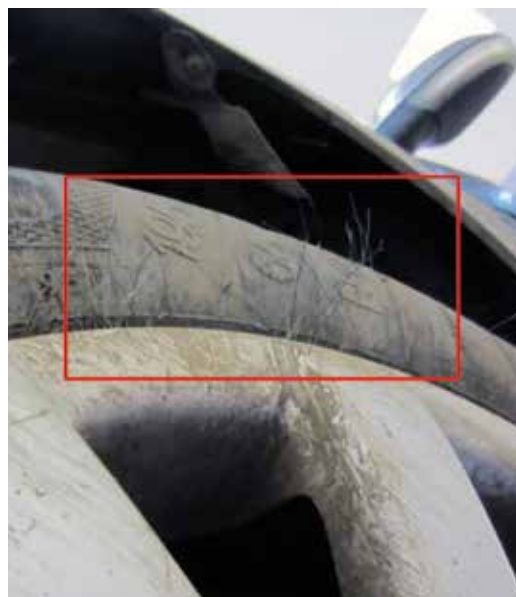
▶ Restos del pelo del jabalí atrapados entre la llanta y el neumático

llegar a introducirse en el habitáculo, dañar el tablero de a bordo, los laterales de los pilares delanteros y el techo.