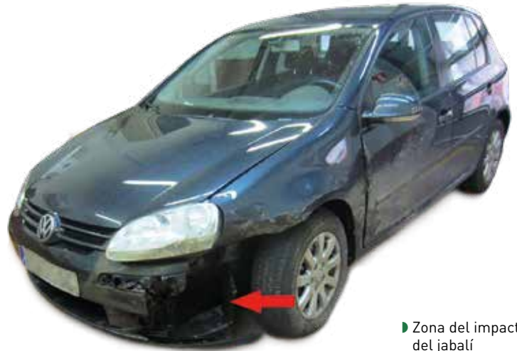
▶ Zona del impacto del jabalí