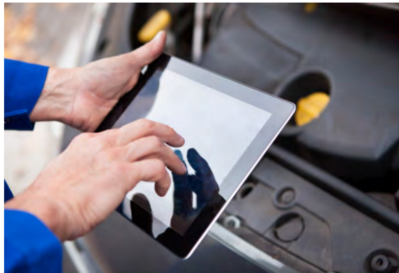
Toma de datos por el propio taller

CESVIMAP puede proporcionar sistemas de certificación on line para talleres de reparación de carrocería, con garantía de calidad, al igual que en modo presencial, facilitando el crecimiento y la innovación, con agilidad y proporcionando al taller datos sobre sus puntos fuertes y sus posibilidades de mejora.