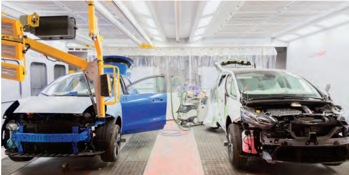
Área de negocio