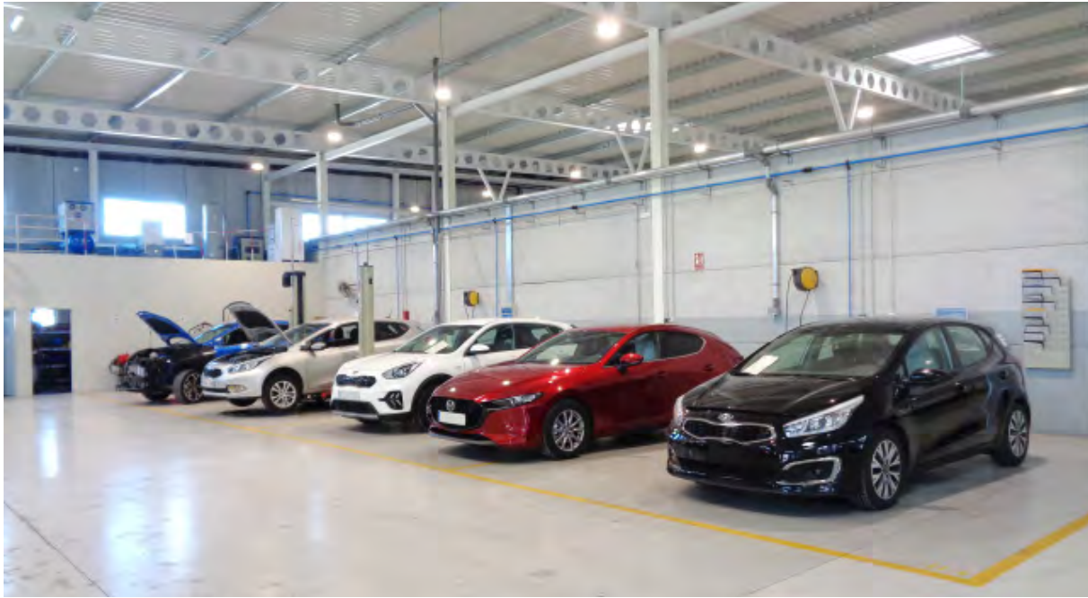
Resultados del taller

Entremos a analizar, en detalle, los aspectos a evaluar en un proceso de certificación de un taller de carrocería y pintura: