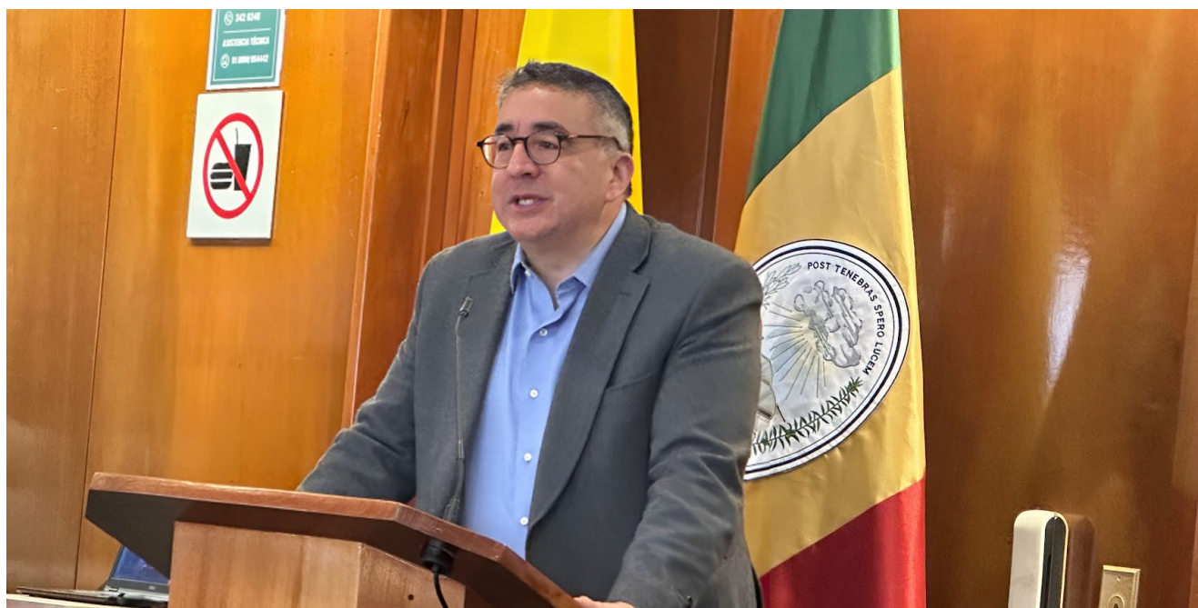
👤 Gustavo Morales Cobo, presidente ejecutivo de Fasecolda

Periodistas de todo el país se dieron cita el pasado 7 de julio en el lanzamiento del Diplomado en Periodismo de Seguros 2023, desarrollado por Fasecolda, en convenio con el Instituto Nacional de Seguros (INS) y la Universidad Externado de Colombia.