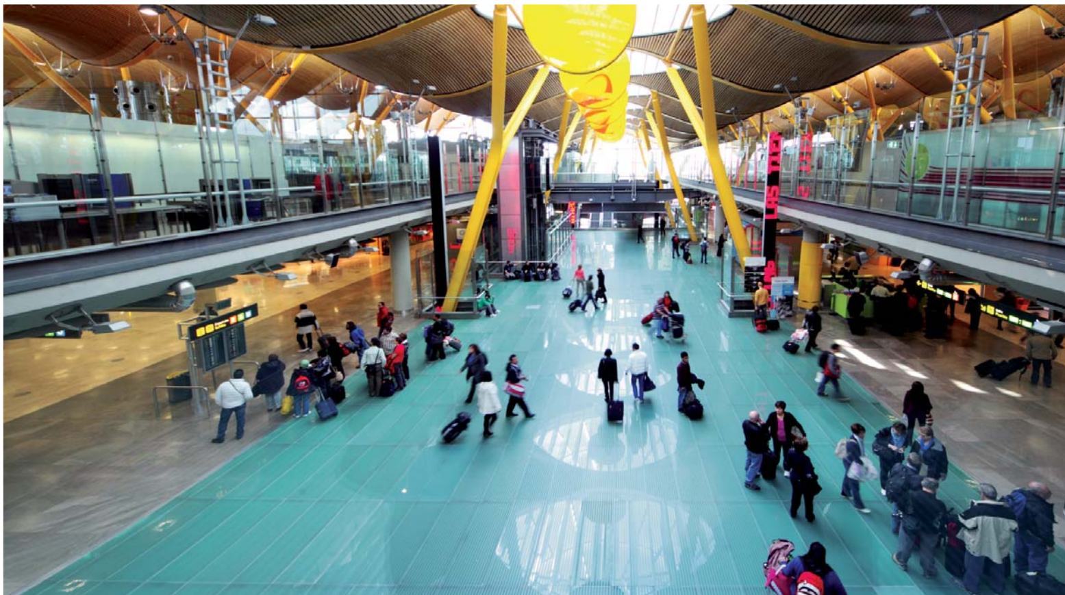
Terminal internacional T4 del aeropuerto de Barajas, en la vanguardia arquitectónica. Madrid. España

El Objetivo de Marca España para 2020 es afianzar una imagen de España como potencia económica y política; un país tradicional y, al mismo tiempo, moderno e innovador; fiable y sólido; solidario; diverso; flexible y abierto al cambio