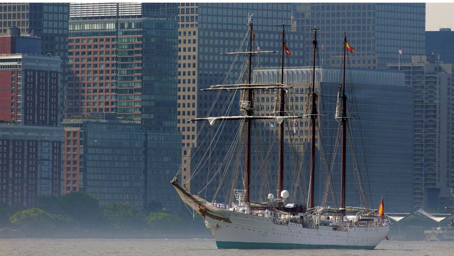
El buque escuela Juan Sebastián de Elcano entrando en el río Hudson en 2012. Embajador Honorario de la Marca España 2009, ha completado desde 1927 un total de 84 cruces de instrucción alrededor del mundo

nuestras Fuerzas y Cuerpos de Seguridad en misiones internacionales de mantenimiento de la paz; aumentar la participación de la sociedad civil en las campañas de divulgación y promoción de la Marca España; y prestar una atención especial a los grandes eventos.