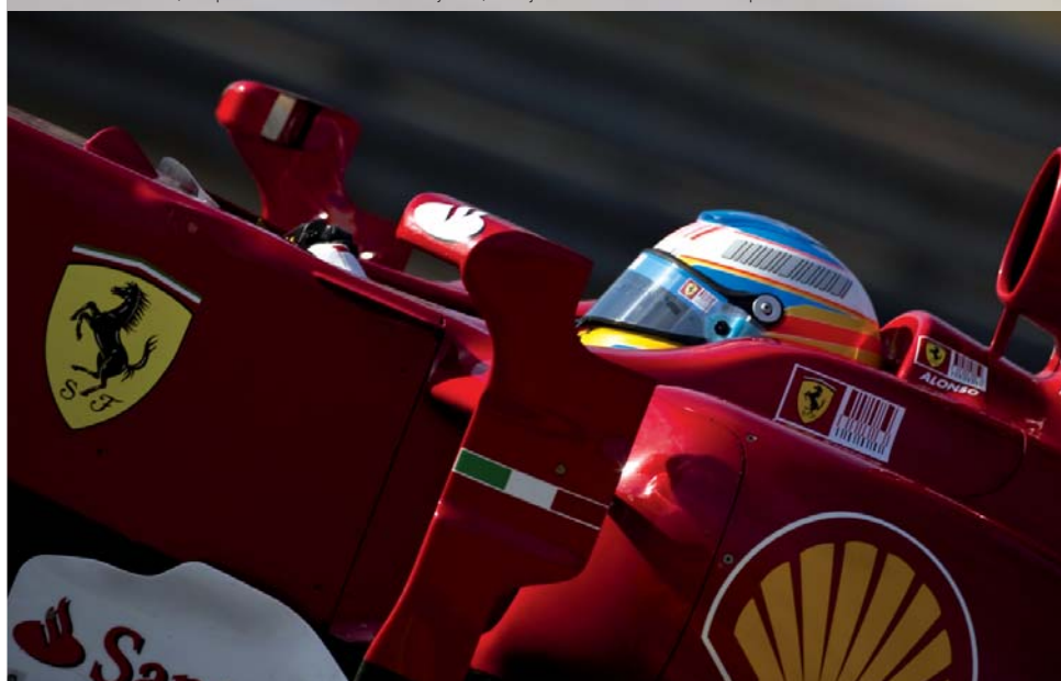
Fernando Alonso, campeón del mundo de F1 en 2005 y 2006, embajador honorario de la Marca España en 2013

Su objetivo es mejorar la imagen de nuestro país, tanto en el interior como más allá de nuestras fronteras, entendiendo que una buena imagen-país es un activo que sirve para respaldar la posición internacional de un Estado política, económica, cultural y socialmente.