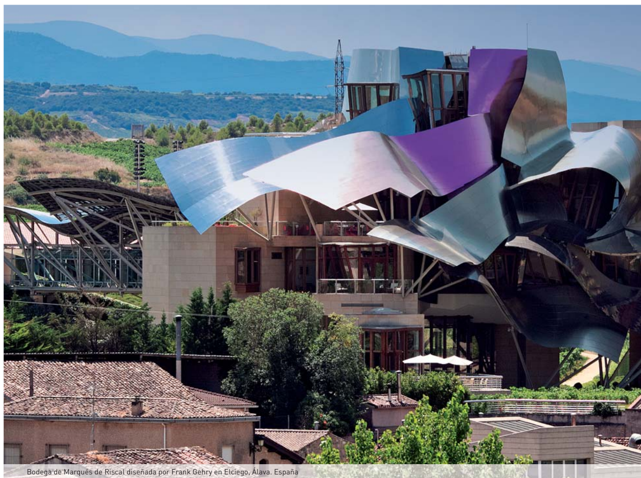
Bodega de Marqués de Riscal diseñada por Frank Gehry en Elciego, Álava, España

La primera labor de Marca España debe ser la de potenciar y afianzar los principios y valores que la inspiran dentro de nuestras fronteras pues difícilmente podremos defenderlos si no creemos en lo que somos y tenemos