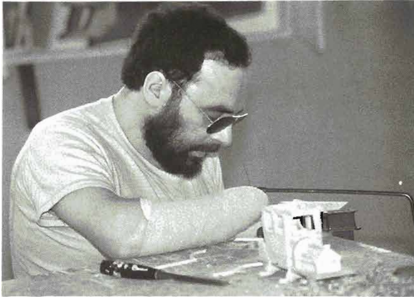
CUADRO N.º 4