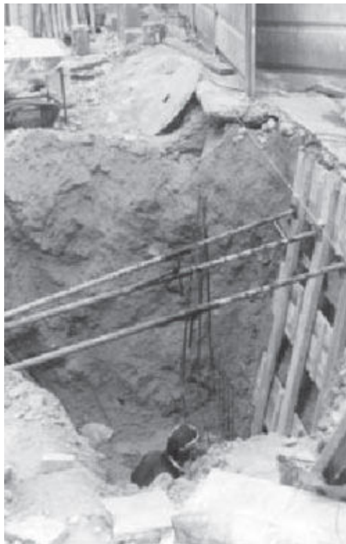
Imagen y mensaje

Al multiplicar la reproducción de la imagen referente a un accidente, pierde su valor motivador