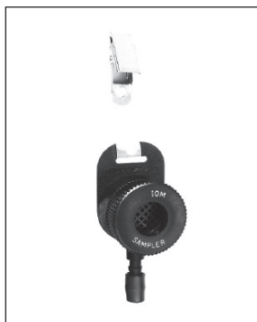
Figura 1. Muestreador IOM

Existen diversas versiones de este muestreador. La primera, era de plástico no conductor, de color castaño, y fue sustituida posteriormente por material de plástico conductor y de color negro, cuyo aspecto puede apreciarse en la Figura 1. La versión en acero inoxidable tiene mayor resistencia y no absorbe humedad, si bien su tara en las determinaciones gravimétricas es superior.