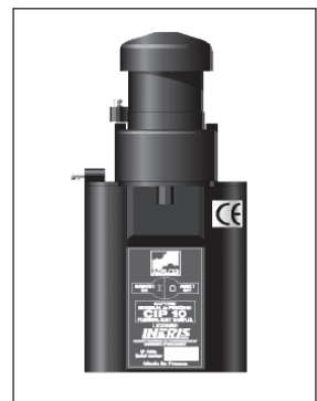
Figura 4. Muestreador Arelco

Los principales inconvenientes de este muestreador se deben al comportamiento higroscópico de la espuma y a los fenómenos electrostáticos. Es recomendable pesar simultáneamente varias "muestras blanco" y hacer las correcciones oportunas (10,19).