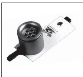
Fig. 6. Muestreador SHS

Este muestreador, con 7 orificios circulares de 4 mm de diámetro, conocido también por las siglas SHS, 7H ó 7HH (“7 Hole Head”), tiene un aspecto similar al muestreador IOM. El aire es aspirado a un caudal de 2 \pm 0,1 l/min, siendo recogida la muestra sobre un filtro de 25 mm de diámetro, apoyado sobre un soporte metálico y cuya naturaleza depende de la aplicación y análisis. Comercialmente, existen 3 versiones de este muestreador: una metálica (fabricante: Casella) y 2 en plástico (fabricantes: SKC y JS Holdings, UK). Ver en la Figura 6, el aspecto de la versión metálica.