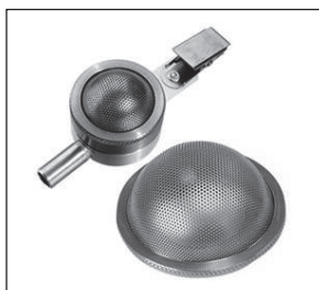
Figura 5. Muestreador Button