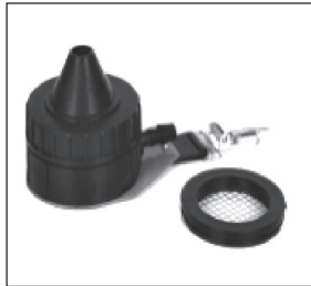
Figura 3. Muestreador cónico CIS

Finalmente, el PAS-6 es otro muestreador de tipo cónico desarrollado en Holanda (Institute of Risk Assessment Sciences), que tiene una geometría parecida al muestreador PGP-GSP 3,5 y al CIS. Es de naturaleza metálica y capta las partículas inhalables de los aerosoles a un caudal de 2 \pm 0,1 l/m sobre un filtro de 25 mm, a través de un orificio de entrada de 6 mm de diámetro.