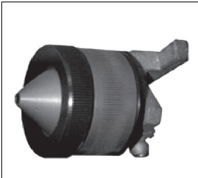
Figura 2. Muestreador PGP-GSP 3,5

El muestreador CIS ( Conical Inhalable Sampler ), muy similar al PGP-GSP 3,5, es fabricado por la firma BGI, Inc, Massachussets (USA) y es considerado como la versión americana. Es de plástico conductor y tiene una sección cónica frontal, con un orificio de 8 mm. El caudal es de 3,5 \pm 0,1 l/m y la muestra se capta en un filtro de 37 mm montado en un portafiltros reutilizable. Ver la Figura 3.