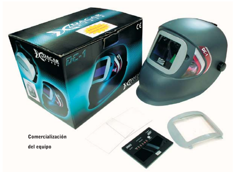
Comercialización del equipo