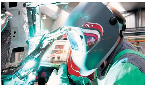
Protección integral frente a UV, IR, humos y chispas

Preparada la careta, antes de soldar es recomendable consultar el factor de protección, según tabla de grados de protección adjunta, para ajustarla correctamente con la tecla correspondiente. El funcionamiento del filtro es automático, por lo que no es necesario encenderlo ni apagarlo. Además, si la soldadura es TIG, se debe presionar la tecla correspondiente. La tecla select permite ajustar manualmente el tiempo de esclarecimiento ( delay ) ✘