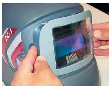
Montaje y desmontaje del protector exterior