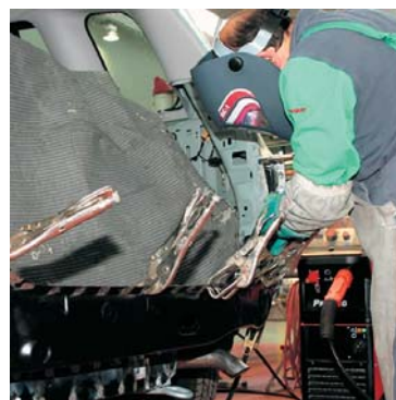
Soldadura MAG sobre acero

La pantalla de soldadura DC-1 con filtro inactivo electrónico ECO 3000 V está indicada para trabajos de soldadura al arco, como soldadura con electrodo, MAG sobre acero y aleaciones ligeras, MIG y TIG. Para trabajar adecuadamente con la pantalla de soldadura conviene ajustarla correctamente a la cabeza, realizando las siguientes operaciones: