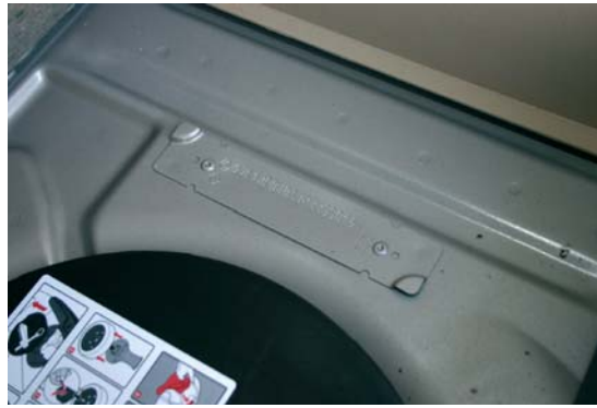
Número de bastidor

El Renault Modus es un nuevo monovolumen que no presenta elementos comunes con los otros vehículos de la marca en el mismo segmento, Twingo y Clio, sino que comparte plataforma con el Nissan Micra, de la que se ha utilizado aproximadamente el 52% de las piezas. En la carrocería del Modus se han empleado distintos materiales: aluminio en el capó delantero y en la travesía del paragolpes delantero, plástico en las aletas delanteras y en el portón trasero, de doble apertura, y aceros de alto límite elástico (HLE) y de muy alto límite elástico (THLE) en zonas específicas, en las que se necesita una mayor resistencia y rigidez. Para la unión de las piezas se utilizan distintas técnicas, destacando la soldadura láser , en la parte delantera, y el adhesivo estructural , como complemento a los puntos de resistencia eléctrica en las zonas de la estructura sometidas a fuertes presiones.