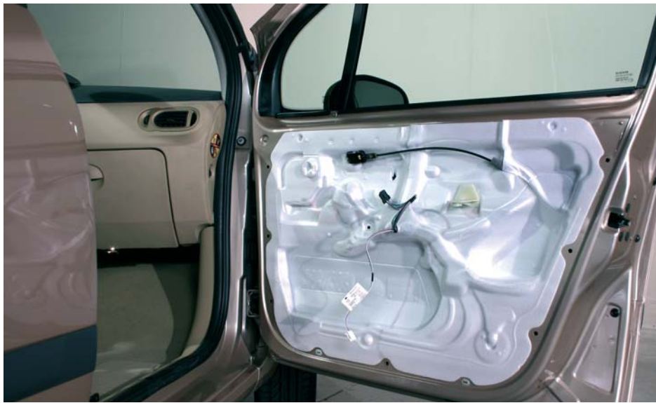
Lámina de estanqueidad