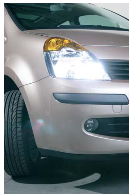
Sistema de luces direccionales de curva