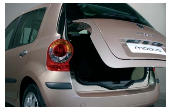
Portón de doble apertura

El frente delantero es una pieza monobloque de material compuesto que no admite reparación