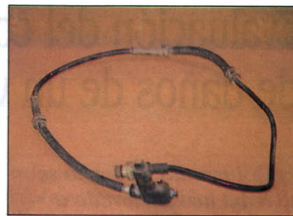
Sensor del sistema antibloqueo.