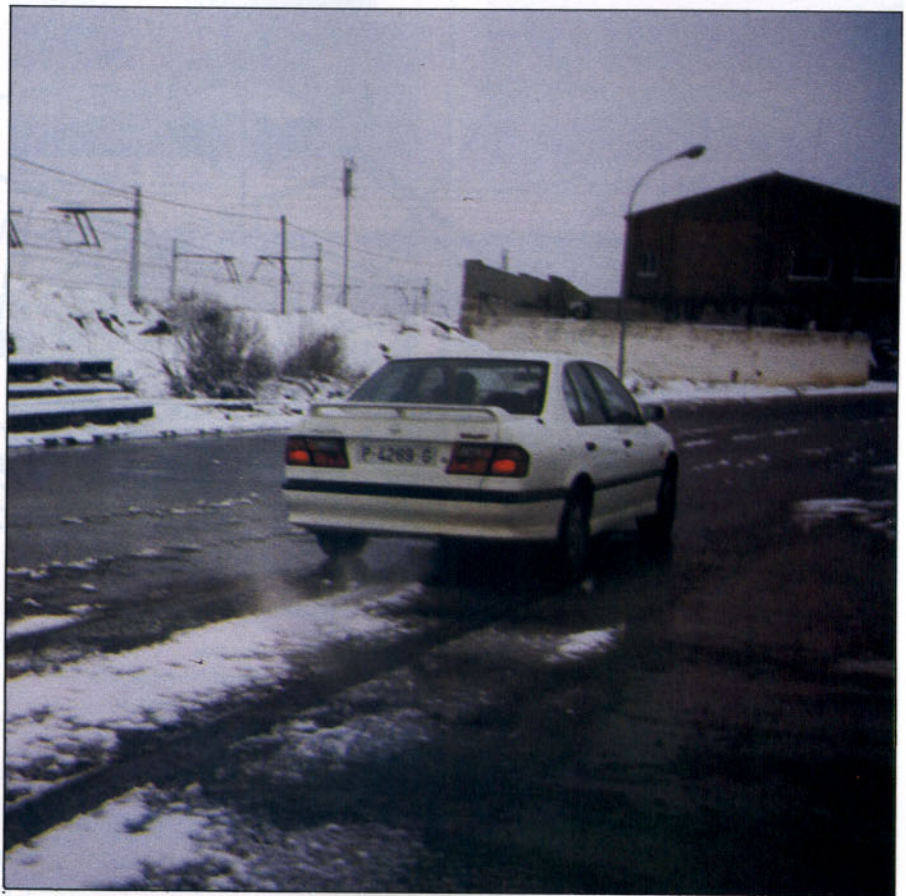
La adherencia del neumático al firme condiciona la frenada.

La solución técnica que impide el bloqueo de las ruedas, en frenadas impulsivas, la proporcionan los sistemas antibloqueo.