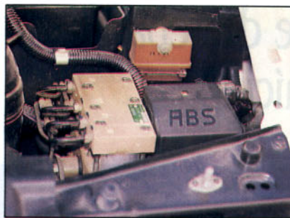
Sistema ABS de Citroen.

El T.C.S. de SAAB es un sistema electrónico completo (combinación de A.S.R. y A.B.S.), ya que utiliza el A.B.S. de cuatro