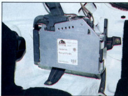
Calculador del Seat Toledo.