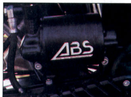
ABS de moto.