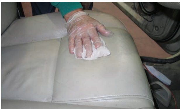
izda. Daño por corte en una tapicería de cuero