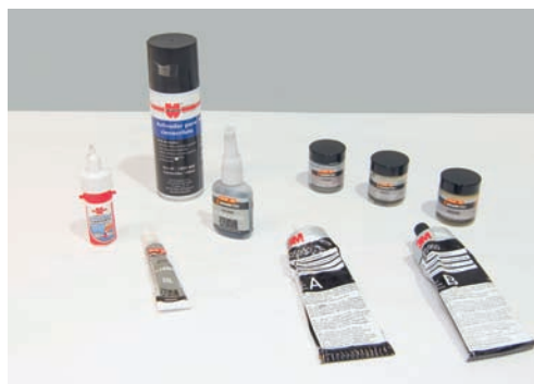
Productos de relleno