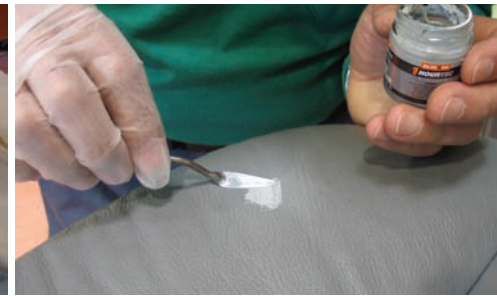
Proceso de reparación de tapicerías de cuero aplicando adhesivo, tinte y masilla

en operaciones relativamente sencillas, como una limpieza general de la pieza, o en otras más complejas, como la reparación de daños como roces, cortes, punzonados o quemaduras.