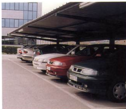
Vehículos aparcados en batería

Aquellas empresas que, por sus dimensiones, dispongan de viales interiores, deberán tener perfectamente definido y señalizado el recorrido, las vías de sentido único, prioridades, zonas de parking, zonas de velocidad restringida, pasos de peatones, etc. Estas medidas harán descender de forma importante los casos de atropello y colisiones, que generalmente se producen a baja velocidad.