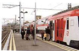
El transporte público es una alternativa para acudir al puesto de trabajo

densidad del tráfico, el empleo del transporte público colectivo (autobuses, trenes de cercanías, metro, etc.) reducirá de forma importante las posibilidades de sufrir o provocar un accidente.