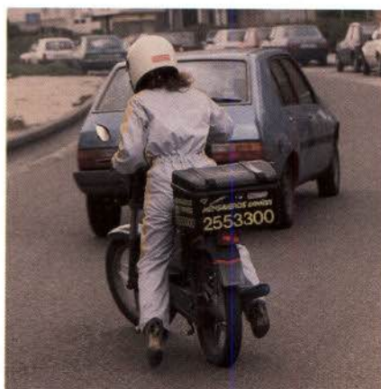
Un mensajero realiza una maniobra

Otro colectivo de alto riesgo son los transportistas de mercancías que, debido al alto número de horas en las que se encuentran sometidos al riesgo, también son propensos a