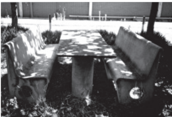
Figura 1. Mobiliario urbano de fibrocemento

El uso de amianto ha sido muy extenso debido a sus propiedades fisicoquímicas, que le proporcionan, entre otras, las siguientes características: gran resistencia al fuego, aislante térmico y acústico, resistencia a los álcalis y ácidos, tixotropante y gran procesabilidad. Por ello, se ha venido utilizando en la construcción, como protección contra el fuego en estructuras metálicas, en paneles acústicos y calorifugados de tuberías, en la fabricación de baldosas y suelos, en placas decorativas de falso techo, como fibrocemento en placas onduladas, planas y tuberías, en pinturas, asfaltos y masillas, etc. Además de este amplio uso en la construcción, el amianto se ha utilizado como aislante en barcos, vagones de trenes, aviones, centrales térmicas y nucleares, en electrodomésticos, en calderas y tuberías y en multitud de aplicaciones. Esta amplitud de uso alcanza al mobiliario urbano, como se puede observar en la figura 1.