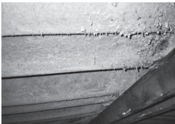
Figura 2. Placas de fibrocemento muy degradadas asimilables a material friable