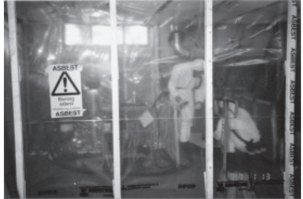
Figura 4. Montaje para obtener el adecuado aislamiento de un trabajo con amianto consistente en la sustitución de una arandela de caucho - amianto de un motor

En la figura 4 se expone un ejemplo de un montaje para obtener el adecuado aislamiento de un trabajo con amianto.