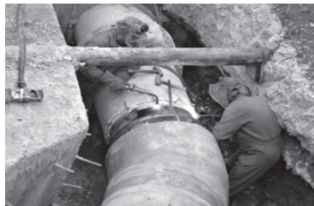
Figura 1. Trabajo en zanjas grandes

La profundidad media aproximada de las zanjas es de tres metros, lo que conlleva colocar la entibación de la misma en función del terreno.