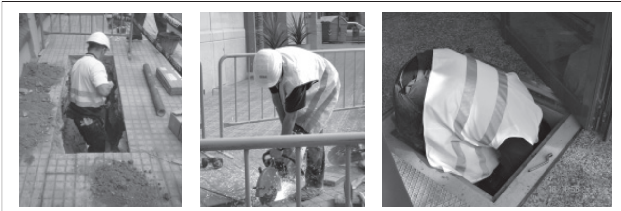
Figura. 3. Trabajo en zanjas pequeñas

La obra se inicia con la apertura manual de catas para localizar los servicios previamente marcados por el responsable de la brigada mediante el localizador.