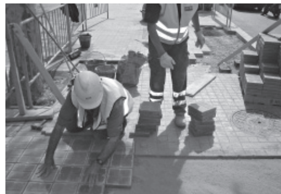
Figura 2. Trabajo en zanjas medianas