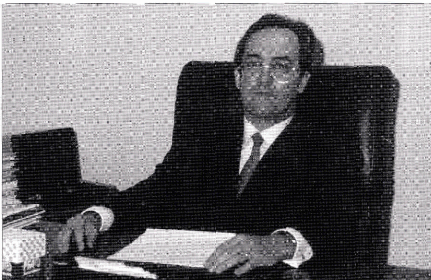
«En España, las compañías francesas tienen un peso importante en el ramo del automóvil».

—Yo diría que no hay muchas diferencias de legislación. Quizá, la prin-