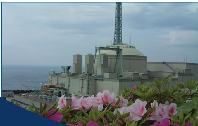
Central nuclear de MONJU

Fuentes: Nucnet News-in-Brief, 1 febrero 2010 y World Nuclear News, 23 febrero 2010