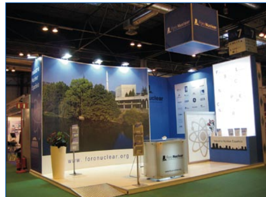
Stand de Foro Nuclear en la pasada edición de Genera

Foro de la Industria Nuclear Española, en representación del sector nuclear español, acude un año más a la Feria Internacional de Energía y Medio Ambiente (Genera 2010) para transmitir que la energía nuclear es parte de la solución al cambio climático, así como una fuente esencial en el mix eléctrico del país. Foro Nuclear expone estas características en el stand 7E10 de la Feria de Madrid (Ifema) del 19 al 21 de mayo y, en paralelo a la exhibición, organiza una Jornada Técnica sobre Energía Nuclear y Medio Ambiente el 20 de mayo en la sala N-112 de este recinto ferial.