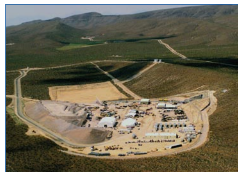
Trabajos en Yucca Mountain

Los estudios y trabajos geológicos en el emplazamiento han empleado durante 25 años 10.000 millones de dólares del Fondo para Residuos Radiactivos constituido con las aportaciones de los consumidores, que ha llegado a 33.000