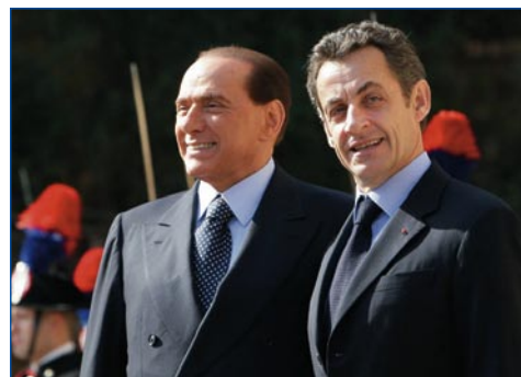
Berlusconi y Sarkozy acuerdan la colaboración nuclear entre Francia e Italia

La nueva empresa estatal Società Gestione Impianti Nucleari (SOGIN) es hoy la propietaria de las cuatro centrales nucleares retiradas del servicio (Latina, Garigliano, Trino y Caorso), así como de las instalaciones del ciclo del combustible y de investigación en Bosco Marengo, Casaccia, Saluggia y Trisaia. Por otra parte, en vista del próximo relanzamiento nuclear, en los planes de SOGIN no figura la intención de enajenar los emplazamientos para que otras empresas construyan centrales nucleares, pero sí admitir socios para emprender estas construcciones en régimen de colaboración.