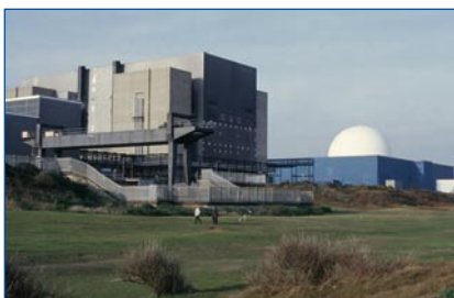
Central nuclear de Sizewell

• Electricité de France, en el Reino Unido EDF Energy, que ha adquirido la antigua British Energy, ha anunciado sus planes de construir dos unidades de tipo EPR de 1.600 MW en Hinkley Point-C, seguidas de otras dos del mismo tipo en Sizewell-C. Se prevé que la solicitud de planificación para Hinkley Point sea presentada en agosto de 2010, para comenzar las obras en 2013 y entrar en servicio a finales de 2017. El plan de Sizewell-C seguirá dos años después, para entrar en servicio en 2019-2020.