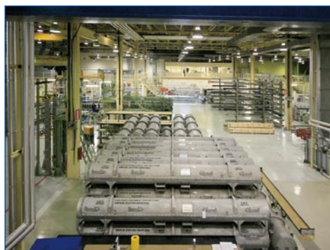
Fábrica de elementos combustibles de Juzbado (Salamanca)

La compañía española Genusa, participada por Enusa Industrias Avanzadas en un 49% y con el 51% restante por la sociedad Global Nuclear Fuel (GNF), constituida por General Electric, Hitachi y Toshiba, ha recibido un pedido por valor de 50 millones de dólares para suministrar cuatro recargas de combustible para las centrales suecas de Oskarshamn 2 y 3. Enusa fabricará el combustible en su instalación de Juzbado.