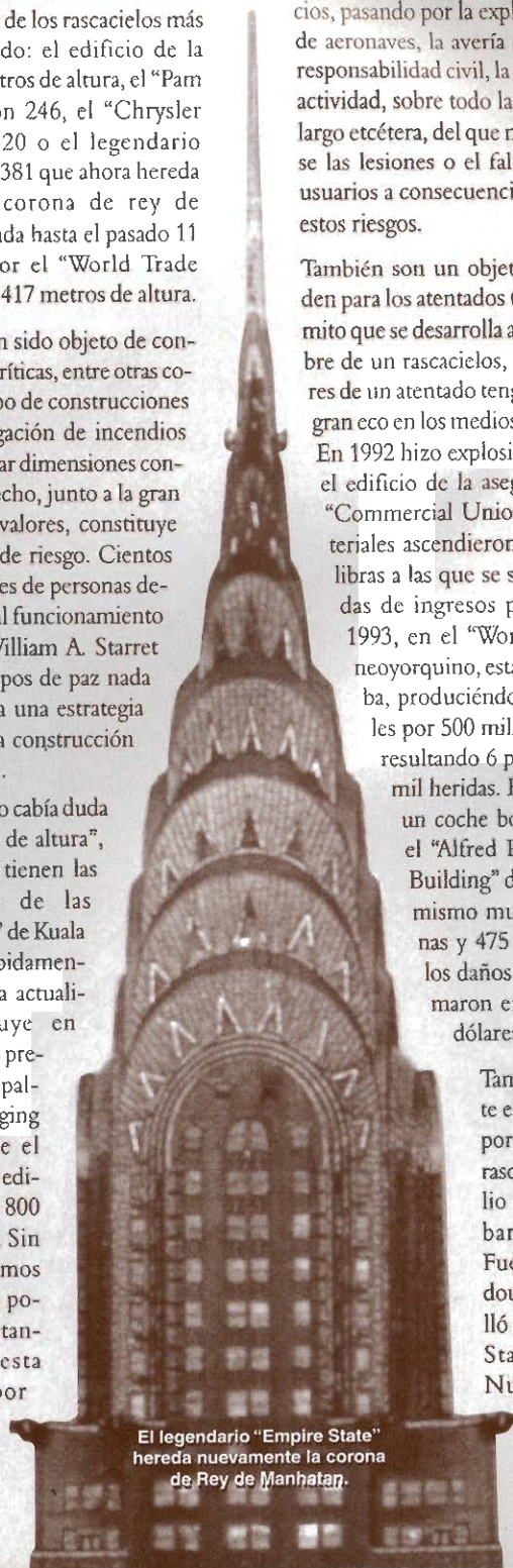
El legendario "Empire State" hereda nuevamente la corona de Rey de Manhattan.

También es importante el riesgo de impacto por aeronaves para los rascacielos. El 28 de julio de 1945 un bombardero B25 de las Fuerzas Aéreas Estadounidenses se estrelló contra el "Empire State Building" de Nueva York, empujándose a la altura de las plantas 78 y 79 que se in-