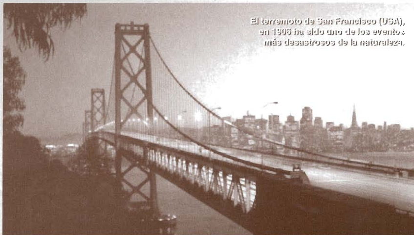
El terremoto de San Francisco (USA), en 1906 ha sido uno de los eventos más desastrosos de la naturaleza.

De los 10.600 millones, 3.000 se debieron a eventos antropógenos —en los que de alguna manera ha tenido que ver la mano del hombre— y 7.500 a siniestros de la naturaleza. Con daños asegurados por 3.000 millones de dólares, las catástrofes técnicas se situaron claramente por debajo del prome-