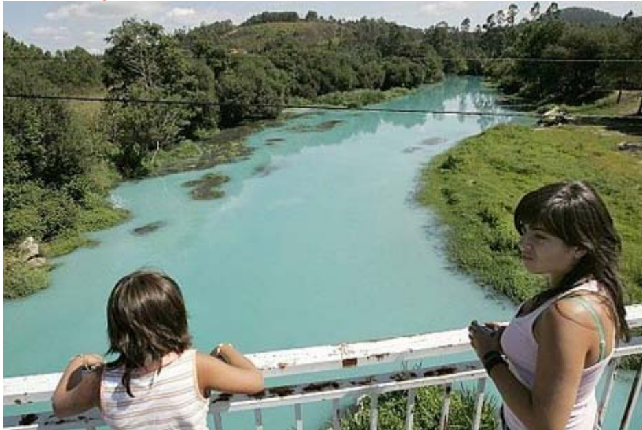
El incendio provocó un vertido en el Umiá que lo tiñó de color verdoso.

Acuerdos extrajudiciales evaporan las reclamaciones civiles por el fuego de Brenntag