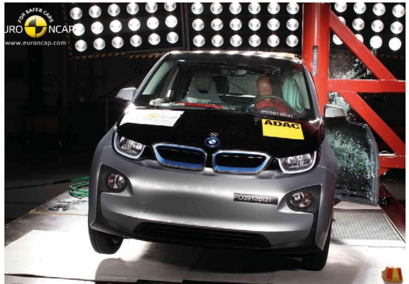
► Han incorporado crash test a vehículos eléctricos

El contenido técnico de la sección Asistencia a la Seguridad no ha variado, pero han