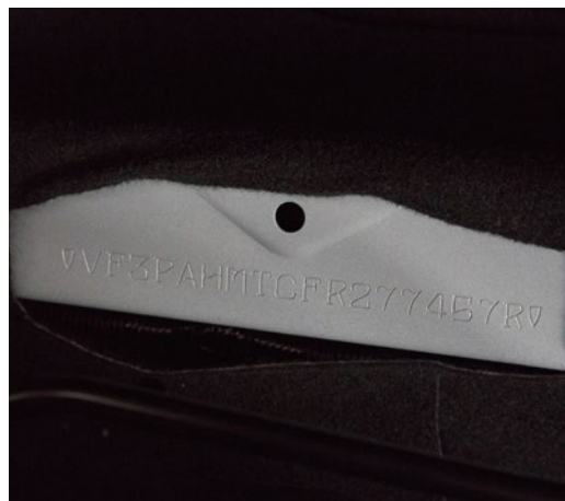
► Número identificativo grabado y troquelado, y retroquelado, derecha