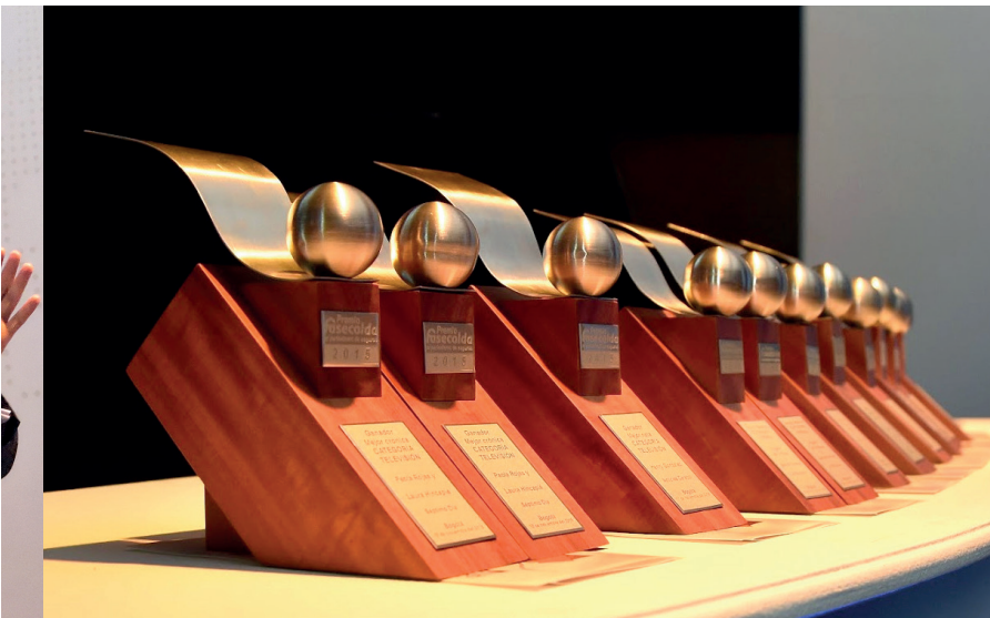
↑ Galardones del Premio Fasecolda al periodismo de seguros

➔ El Premio Fasecolda al periodismo de seguros reconoce la labor diaria de los periodistas que informan al país sobre los riesgos a los que están expuestos y los mecanismos que tienen para protegerse.