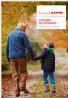
Sistemas de pensiones

todas las áreas de la actividad de la sociedad. En esa medida, al investigar cualquier área de actuación en la que el seguro interviene, se analiza también la actividad económica o social a la que se encuentra ligada. Desde los mecanismos para la protección de los medios que dan continuidad al funcionamiento económico, pasando por el impacto económico y social de las catástrofes naturales, y hasta los mecanismos que proveen estabilidad y equidad a la convivencia social como los sistemas sanitarios o de pensiones. Por eso los temas potenciales que pueden abordarse desde un área como el Servicio de Estudios son muchos. Aun así, creo que hay un espacio específico en el que deberemos centrar nuestra atención en los próximos años, dada su especial relevancia por el momento que vive la sociedad global. Un espacio conformado por los riesgos que derivan de cuatro vértices: el efecto económico del rápido avance del proceso tecnológico, el impacto social y económico del acelerado proceso de envejecimiento de las poblaciones del mundo, la forma de revertir la tendencia a la desaceleración/estancamiento de la economía global, y la necesidad de lograr mayores niveles de equidad económica que doten de estabilidad a la convivencia social. Creo que en el área que forman esos vértices se encuentran, sin duda, buena parte de los temas (económicos y aseguradores) que requieren de que todos contribuyamos con análisis y respuestas.