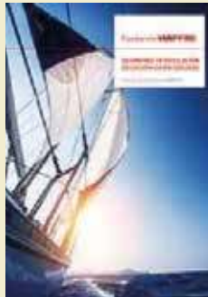
Estudios: Inversiones - Sector asegurador y Regímenes de regulación de solvencia en seguros

de los estudios e informes que elaboramos, y la instancia principal en las labores de difusión de nuestros trabajos. El Servicio de Estudios es un área dentro de la estructura corporativa del Grupo MAPFRE, así que nuestra relación con Fundación MAPFRE busca preservar rigurosamente la debida separación que debe existir entre ambas entidades. Así, el papel que desempeña Fundación MAPFRE ha resultado decisivo en los avances y logros que hemos alcanzado hasta ahora, ya que el prestigio y presencia de la Fundación a través de sus diferentes actividades, ha permitido que nuestros informes lleguen a un amplio público interesado en el análisis del sector asegurador en el mundo.