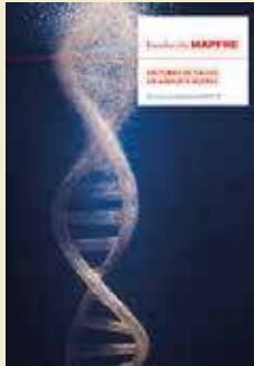
Sistemas de salud, un análisis global

a estos problemas en paradigmas parciales y circunscritos a las fronteras nacionales. Eso ha dejado de ser útil. Hoy día, la economía y la sociedad son globales. Solo en esa dimensión podemos imaginarlas y solo en esa dimensión seremos capaces de encontrar las soluciones correctas a sus problemas.