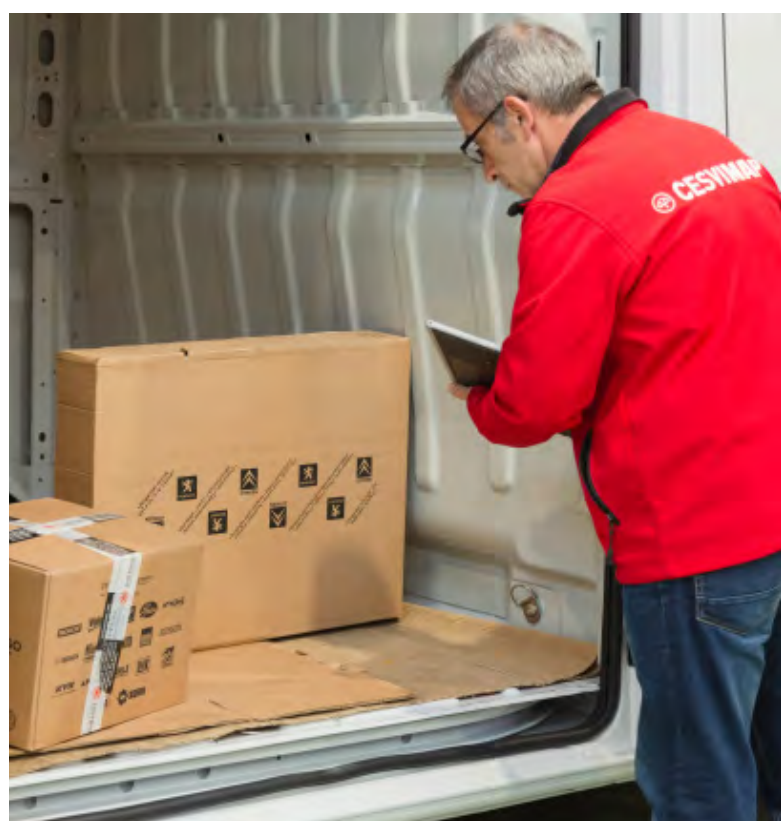
El jefe de taller verifica el recambio recibido

Atendiendo a estas tres variables, talleres y peritos estarán pendientes de: