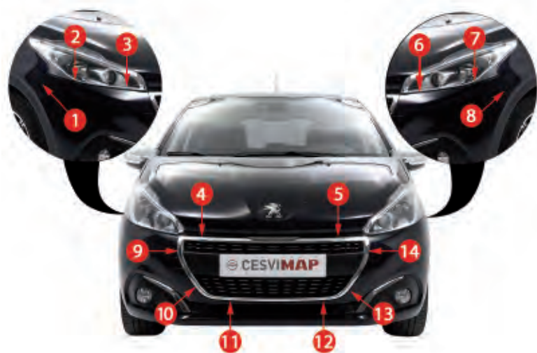
Puntos de verificación del ajuste de la pieza en el vehículo

Sin embargo cambia con la pieza de calidad equivalente. En este caso, las calidades que po-