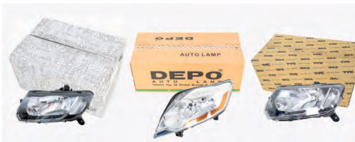
Ejemplos de faros de los distintos tipos de recambio

OES es el recambio del fabricante de primer equipo, esto es, el proveedor del constructor del vehículo, que se suministra por un canal de comercialización y con una referencia distinta a la de la marca del vehículo; el embalaje y la identificación de la pieza le corresponden al fabricante del recambio. Este tipo de piezas se fabrica siguiendo las especificaciones del constructor del vehículo. Por último, hablamos del recambio IAM, recambio independiente, fabricado por empresas