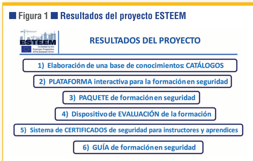
■ Figura 1 ■ Resultados del proyecto ESTEEM

El equipo está formado por investigadores del instituto IDOCAL de la Universidad de Valencia, de la Universidad de Sheffield y de la Universidad de Bolonia, y también por profesionales de empresas relacionadas con la prevención, la formación y el sector de la construcción. En España la empresa que forma parte del equipo es Valora Prevención y hemos contado con la colaboración del Instituto de Seguridad y Salud en el Trabajo (INSST), que ha proporcionado orientaciones en relación con la formación de seguridad y salud en el sector de la construcción. En el comité asesor ha participado también la Agencia Europea para la Seguridad y la Salud en el Trabajo, junto a organismos de los otros países participantes. Los resultados producidos en el proyecto se pueden ver en la figura 1.