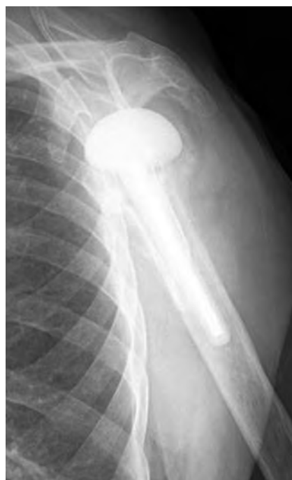
Fig. 2. Radiografía de control. Espaciador de cemento con antibióticos.

lococcus Aureus resistente a la meticilina, así como a plantear la retirada de la prótesis junto a colocación de espaciador cementado (Figura 3) con gentamicina y un sustitutivo óseo con vancomicina y tobramicina (Per Ossal®).