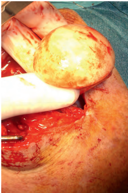
Fig. 4. Retirada de espaciador cementado.

mana, pasando luego a linezolid por vía oral, durante tres meses. A los cuatro meses se retiró el espaciador de cemento (figura 4), presentando valores de PCR de 10,2 mg/L y VSG de 9 mm/h. Clínicamente presentaba una limitación a la movilidad pasiva hasta 90° en abducción y flexión anterior, siendo el movimiento activo hasta 40° en ambos arcos. Dada la historia clínica infecciosa, y los de-