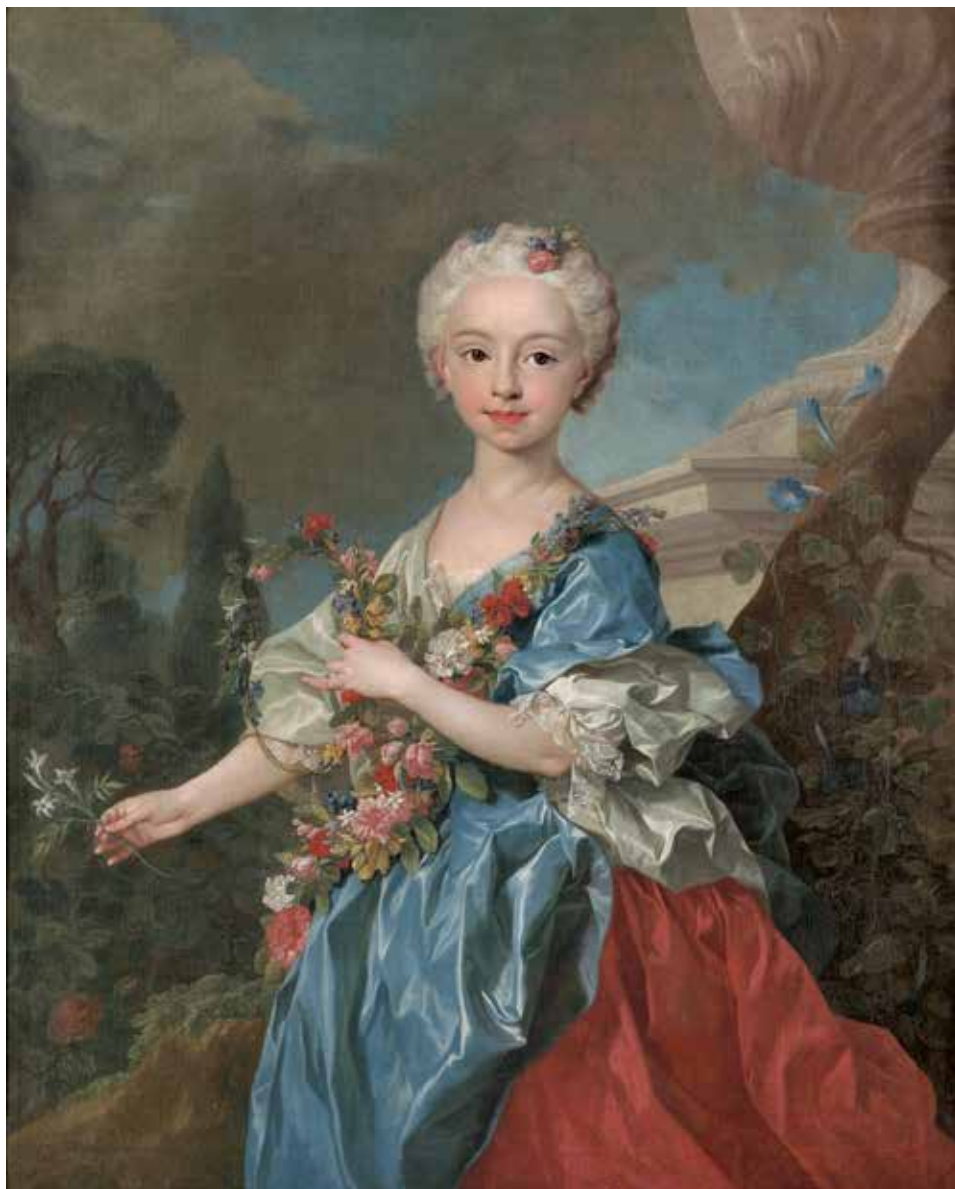
Louis-Michel Van Loo María Antonia Fernanda de Borbón, infanta da Espanha, ca. 1737 Óleo sobre tela, 88,3 x 71,3 cm Museu de Belas Artes de Astúrias. Depósito da coleção do IX conde de Villagonzalo

Ranc. Em 1735, Louis-Michel Van Loo substituiu este último e tornou-se o primeiro pintor do rei, além de diretor de pintura da Real Academia de Belas Artes de San Fernando, fundada em 1752. Um dos retratos pintados por ele é María Antonia Fernanda de Borbón, Infanta de Espanha , ca. 1737.