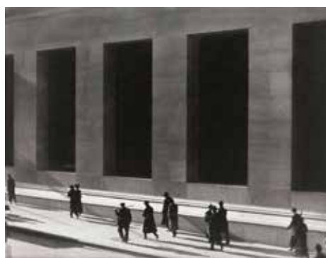
Paul Strand Wall Street, New York [Wall Street, Nueva York], 1915 Colecciones Fundación MAPFRE