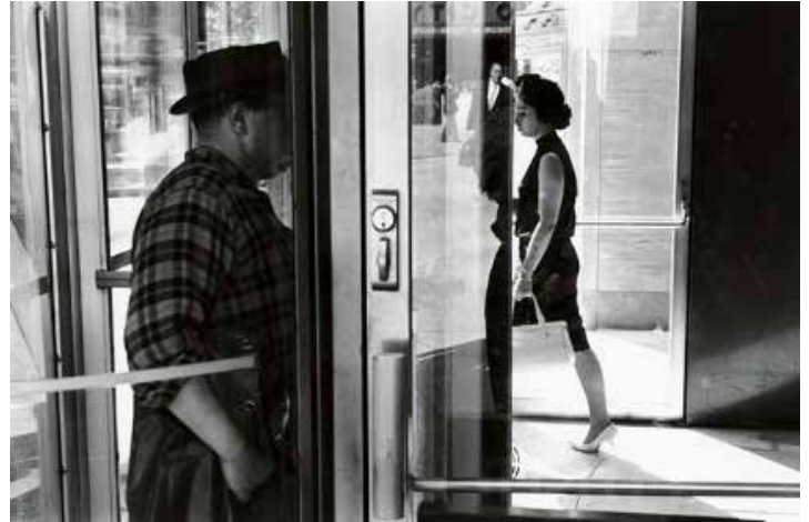
Lee Friedlander New York City , 1963

Centro de Fotografía KBr De 18/02/2022 a 15/05/2022