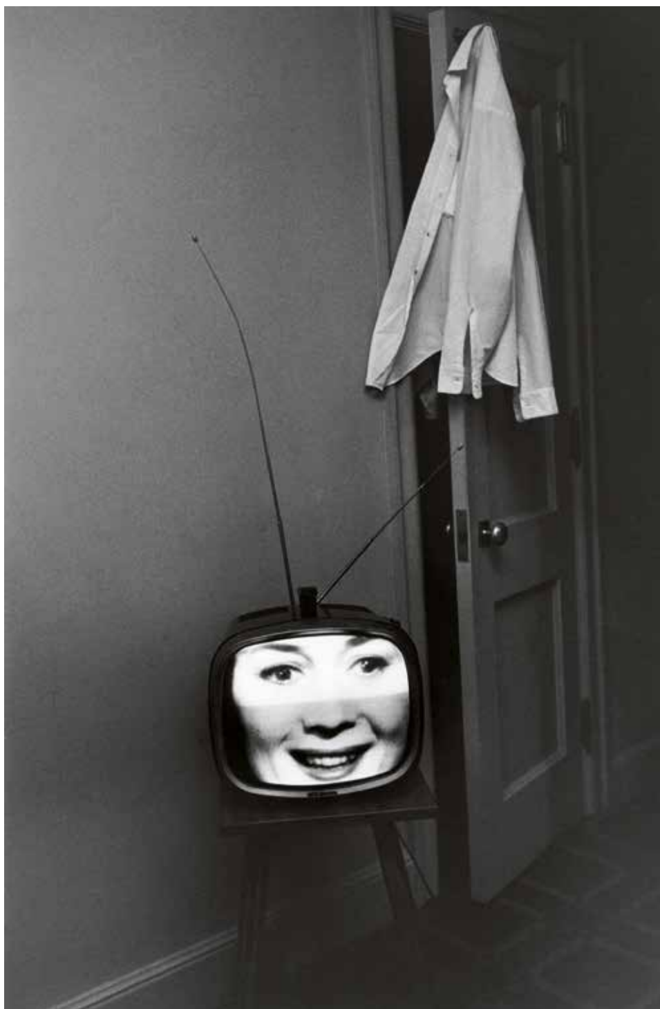
Nashville, 1963 Imagem em papel de gelatina e prata

a Social Landscape , organizada pela George Eastman House de Rochester. E, no ano seguinte, na modesta, mas emblemática exposição New Documents , organizada por John Szarkowski, também no MoMA de Nova York. Nela, Lee Friedlander estava acompanhado por Garry Winogrand e Diane Arbus, os trabalhos destes três artistas são considerados as grandes renovações da fotografia do século XX.