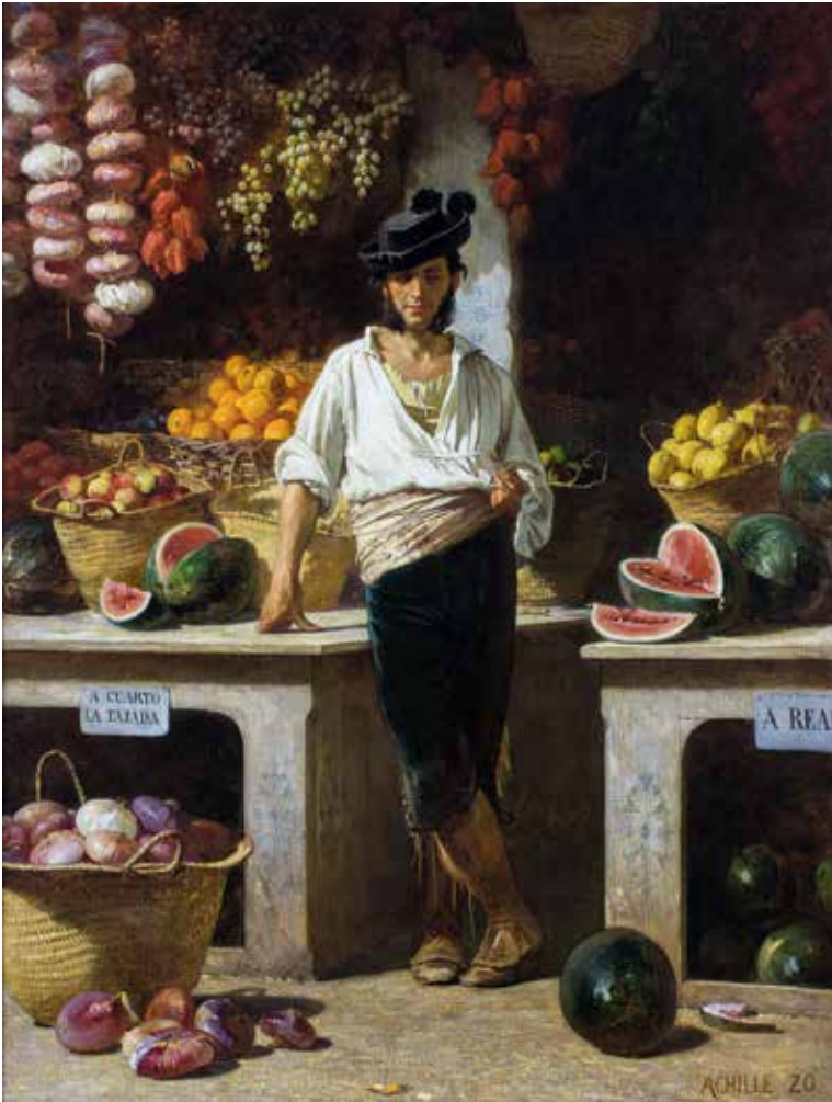
Jean-Baptiste Achille Zo Vendedor de frutas em Sevilha, ca. 1864 Óleo sobre tela, 116,3 x 89,6 cm Coleção BBVA