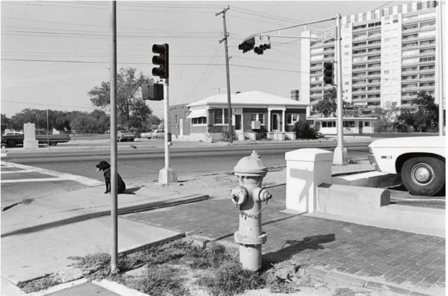
Albuquerque, Novo México, 1972 Imagem em papel de gelatina e prata

imagens que compõem o livro America by Car , publicado em 2010, acentuam a dimensão do espaço que Friedlander alcança graças ao formato quadrado de sua câmera Hasselblad. Nessa ocasião, o artista usa o interior do carro como moldura fotográfica para enquadrar suas paisagens de um ponto de vista familiar a quem já viajou pela estrada. O resultado são imagens que incluem sombras, volantes, painéis e espelhos retrovisores nos quais se inserem pontes, monumentos, igrejas, motéis e bares, levando ao extremo a complexidade das composições