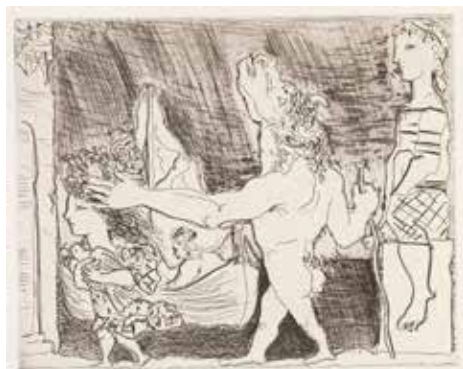
Pablo Picasso Minotauro ciego guiado por una niña, II, 23.10.1934 Suite Vollard-Miscelánea