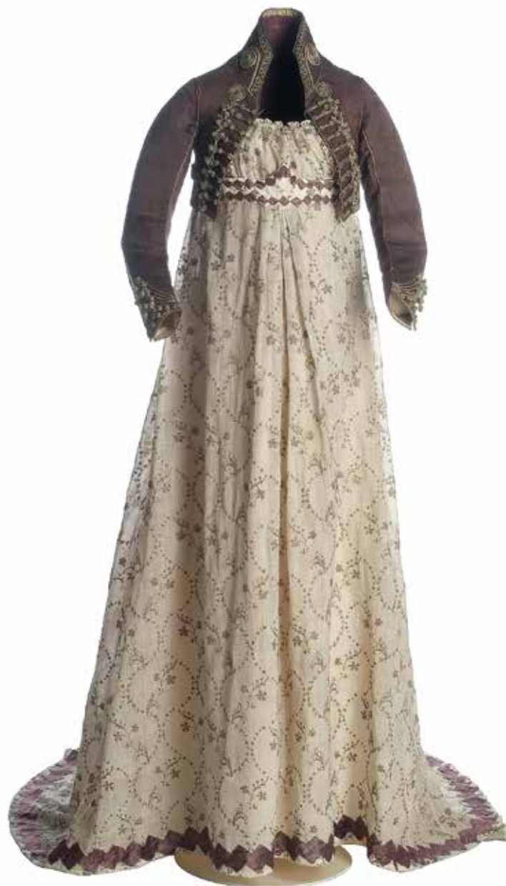
Manufatura francesa Vestuário feminino composto por vestido-camisã e «spencer» [casaco curto ou bolero], ca. 1810 Prata, seda, tafetá e sarja Museu do Traje, Madrid