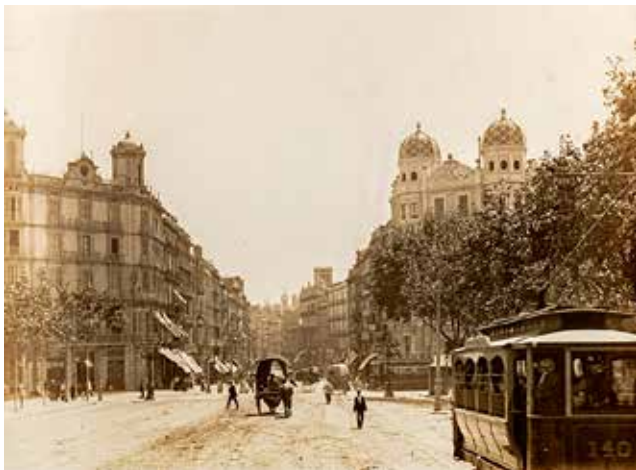
Adolf Mas Ginestà Vista de la Puerta del Ángel , 1902

Centro de Fotografía KBr De 18/02/2022 a 15/05/2022