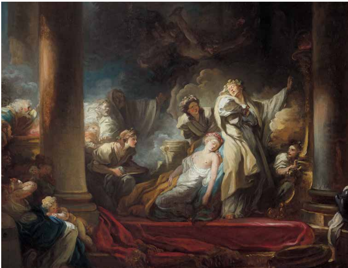
Jean-Honoré Fragonard O sacrifício de Callíroé , 1765 Óleo sobre tela, 65 x 81 cm Museu da Real Academia de Belas Artes de San Fernando, Madrid