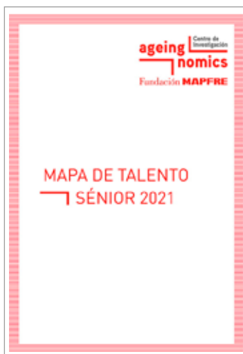
Capa do relatório Mapa de Talentos Sênior 2021 , elaborado pelo Centro de Pesquisas Ageingnomics da Fundación MAPFRE