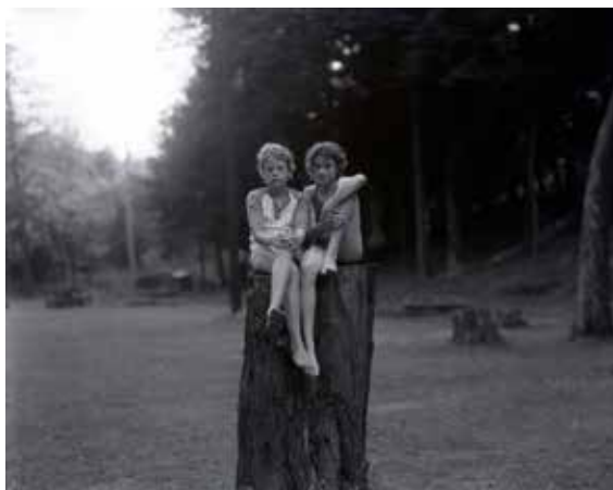
Judith Joy Ross Sin título, Eurana Park, Weatherly, Pensilvania, 1982 © JUDITH JOY ROSS, COURTESY GALERIE THOMAS ZANDER, COLOGNE