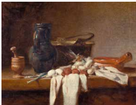
Jean-Baptiste-Siméon Chardin Natureza morta com pilão, jarro e caldeirão de cobre, ca. 1728-1732 Óleo sobre tela, 32,5 x 39 cm Museu Nacional Thyssen-Bornemisza, Madrid

O GOSTO FRANCÊS E SUA PRESENÇA NA ESPANHA (SÉCULOS XVII-XIX)