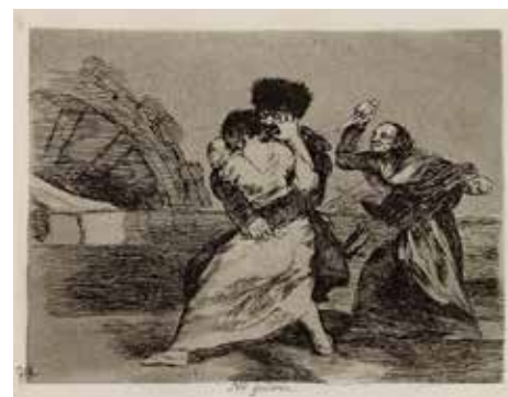
Francisco de Goya y Lucientes No quieren, ca. 1810-1814 Desastres de la Guerra de Francisco de Goya y Lucientes