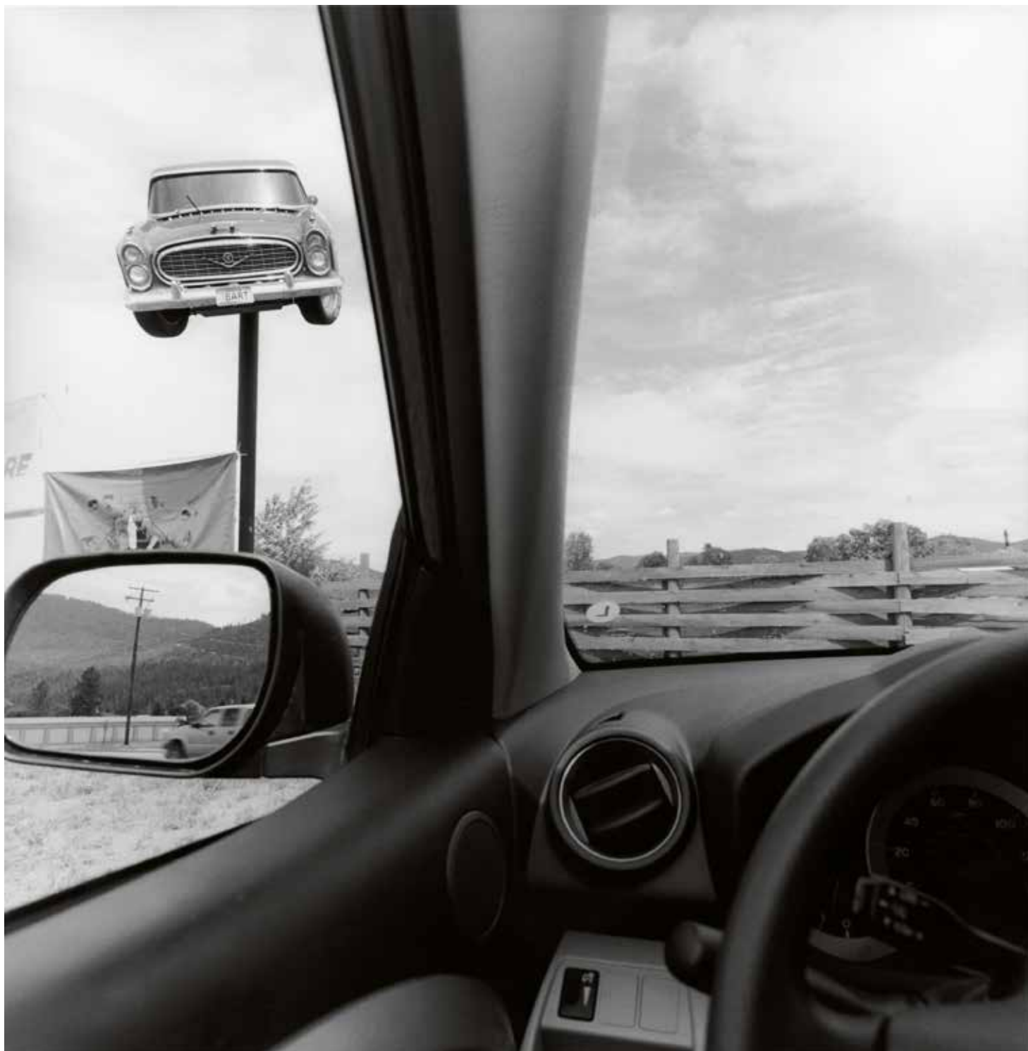
Montana, 2008 Imagem em papel de gelatina e prata

Ao longo de toda a sua carreira, Lee Friedlander vem retomando os temas de suas fotografias repetidamente, em um contínuo work in progress que é enriquecido pelo aprendizado sobre o meio e a experiência.