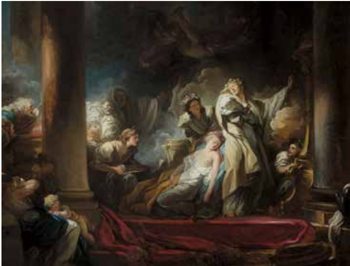
Jean-Honoré Fragonard El sacrificio de Calíroé, 1765 Museo de la Real Academia de Bellas Artes de San Fernando, Madrid

Sala Recoletos De 11/02/2022 a 08/05/2022