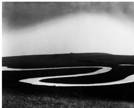
Bill Brandt Río Cuckmere, 1963 Colección privada.