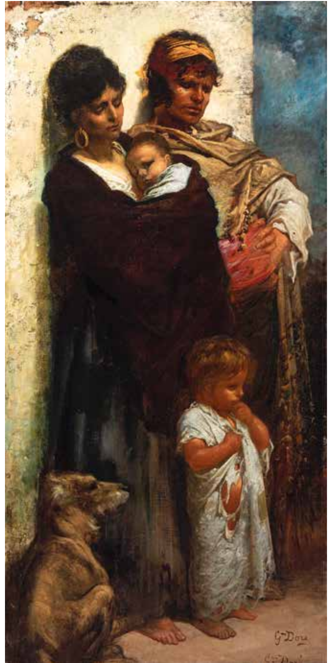
Gustave Doré Os Andarilhos, ca. 1868-1869 Óleo sobre tela, 197 x 95 cm Museu de Belas Artes de Bilbao

Embora a percepção do «o que é espanhol» na França tenha variado ao longo do século XIX, após a Revolução de 1848 será cada vez mais frequente a associação da cultura espanhola com a imagem de um povo arcaico e livre, em oposição