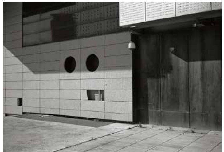
Jorge Ribalta CCIB, plaza de Willy Brandt 11-14 , 15 de junio de 2011 De la serie «Futurismo»

Sala Recoletos De 11/02/2022 a 08/05/2022