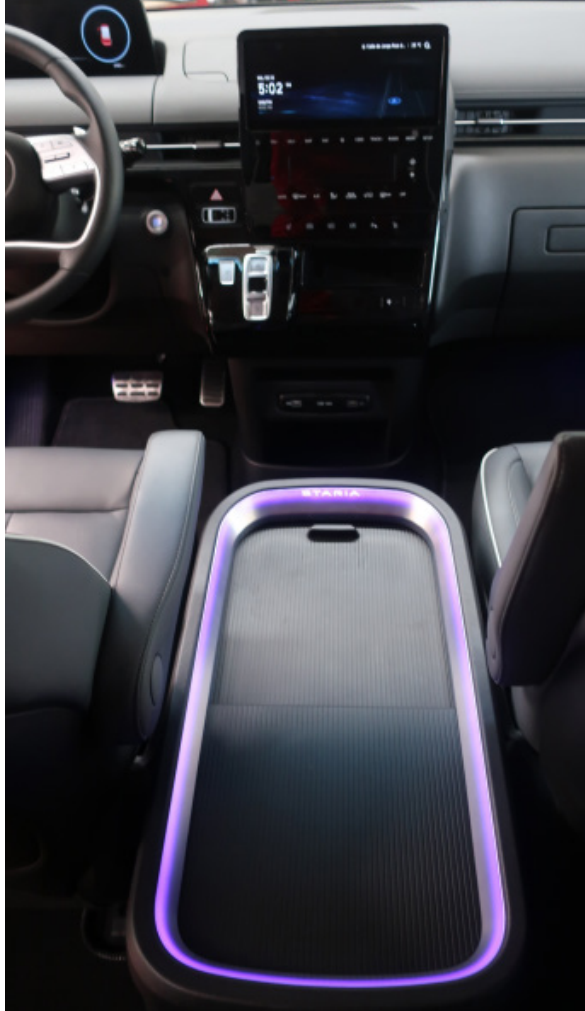
Plásticos resistentes al rayado y de tacto suave en el interior del vehículo

servirá para abrir el coche. Una vez en el interior, habrá que volver a teclear otro código en la pantalla táctil central para arrancar y conducir el vehículo. Este sistema permitirá, por ejemplo, dejar el teléfono/llave en el interior del coche para que no nos moleste llevarlo encima cuando salgamos a correr o vayamos al gimnasio.