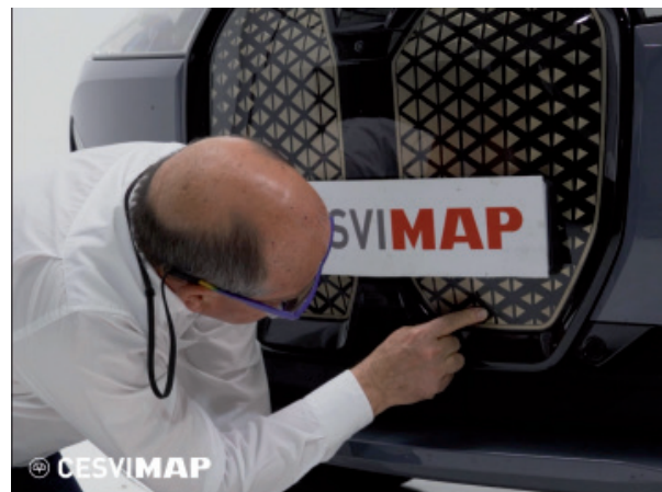
Arriba, plástico autorreparable en la calandra del BMW iX. Reparación de un arañazo con la sola aplicación de calor. Abajo a la izquierda, plástico resistente a las quemaduras. Abajo a la derecha, análisis de la calandra del BMW iX en CESVIMAP.