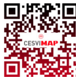
El BMW iX, en CESVIMAP

Por ejemplo, el nuevo BMW iX , lanzado por la marca este año 2022, incorpora plásticos autorreparables en su rejilla frontal. Para fabricar la calandra -meramente estética, ya que es un coche eléctrico y no necesita refrigeración- se emplea un proceso de recubrimiento al vacío a nanoescala. Un revestimiento de poliuretano con nanocápsulas de agente reparador crea esta superficie, con efecto de autorreparación ante pequeños daños, como pequeños impactos de piedras o roces. En 24 horas, a temperatura ambiente y por estímulos externos, como el calor o la luz (no requiere de intervención humana) pueden estar reparados. También se puede forzar la reparación mediante la aplicación de calor controlado con aire caliente. Accede desde este código QR a un vídeo en el que te mostramos el comportamiento de estos plásticos.