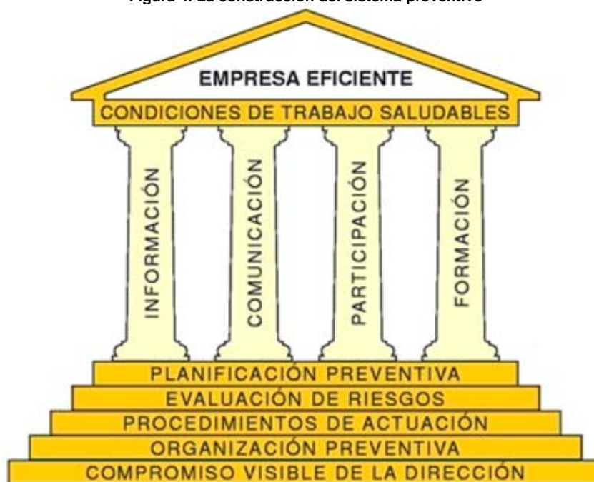
Figura 4. La construcción del sistema preventivo

Si la implantación del sistema preventivo se realiza correctamente, la empresa tendrá unas condiciones de trabajo saludables, y por ello podrá ser más eficiente.