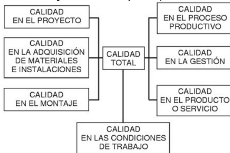
Figura 1. La calidad total y sus componentes

Por ello, el logro de la calidad en las condiciones de trabajo o calidad de vida laboral es una función gerencial, que debe ser gestionada con el mismo rigor y las mismas estrategias que otras funciones empresariales.