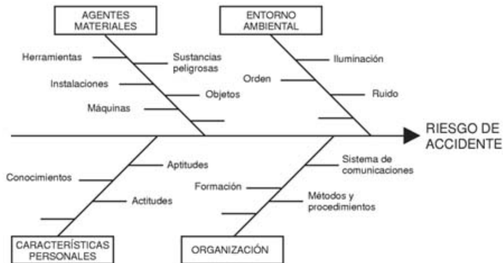
Figura 5. Factores que intervienen en la producción de accidentes

Podrían existir factores de riesgo significativos que, en algunas situaciones, no quedarán suficientemente reflejados en esta metodología. De ahí que las conclusiones que pueden extraerse respecto a los riesgos de accidente son limitadas.