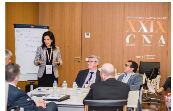
Imágenes de la sesión práctica junto a los participantes en la mediación empresarial.