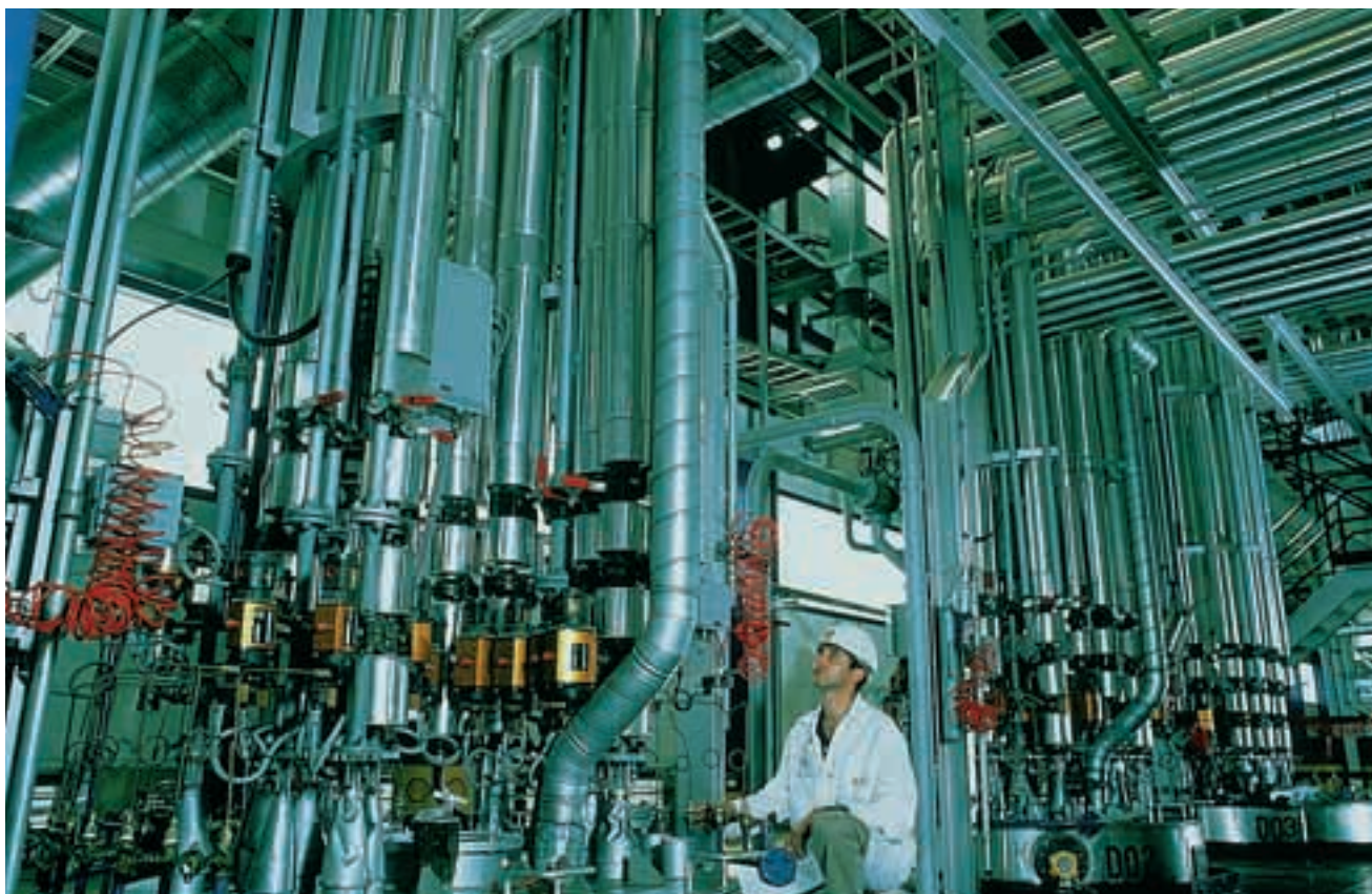
Algunos riesgos en este tipo de macroproyectos, son la complejidad de las obras y su peligrosidad específica.

- Puede haber una serie de empresas que no desplacen ni concierten Servicios de Medicina y Seguridad.