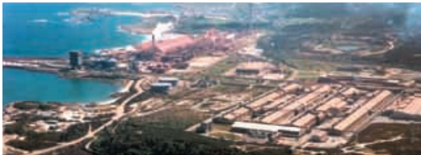
Vista parcial de la planta de alúmina y aluminio de Alcoa Europe en San Ciprián (Cervo, Lugo).

Existe un problema en la bibliografía y referencias existentes en materia de gestión de riesgos laborales en construcción. Por un lado, la bibliografía y otras referencias existentes que son específicas de este tema (European Construction Institute, 1996; Kolluru et al. , 1996; entre otras) no contemplan una visión tan amplia como la que se refleja en este proyecto, fundamentalmente porque no están concebidas para mega-proyectos, sino para esa gran mayoría de proyectos pequeños y medianos que configuran el día a día del sector de la construcción. O bien se centran exclusivamente en las técnicas cualitativas y cuantitativas de análisis de riesgos. Por otro lado, las referencias genéricas en gestión de riesgos (De la Cruz, 1998; Del Caño y De la Cruz, 2000; Chapman y Ward, 1997; Project Management Institute, 2000; Simon et al. , 1997, entre otras) pueden contemplar de manera muy acertada y detallada el proceso genérico de gestión de riesgos genéricos (de alcance, plazo, coste, calidad, seguridad, etc.) en la dirección del proyecto para cualquier tipo de proyecto, o incluso, específicamente, para proyectos de construcción, si bien al plantear una metodología genérica no descienden al detalle en cada uno de los tipos de riesgos, y menos en el caso del riesgo de seguridad y salud. Este artículo pretende abrir una línea de trabajo en este sentido y está basado en la ex-