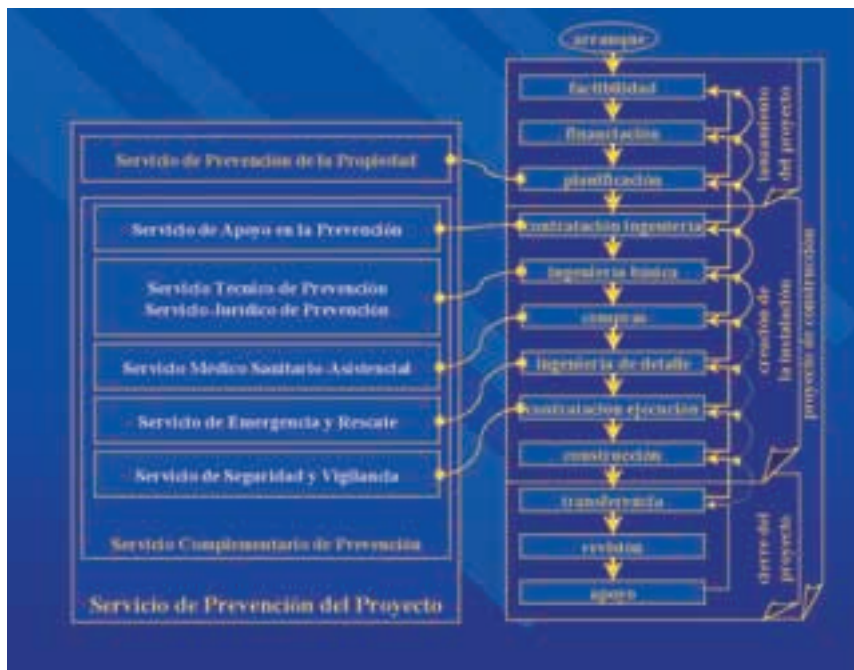
Figura 4. Esquema del equipo de prevención del proyecto y de su proceso de creación en relación con las fases y etapas del proyecto.

Con respecto al jefe del Servicio de Prevención (jefe de Prevención), se establecen dos períodos en los cuales la dependencia varía conforme avanza el proyecto. El primer período comprende las fases de lanzamiento del proyecto y de creación de la instalación. En este período dependerá jerárquicamente del jefe de los Servicios Generales de Prevención de la com-