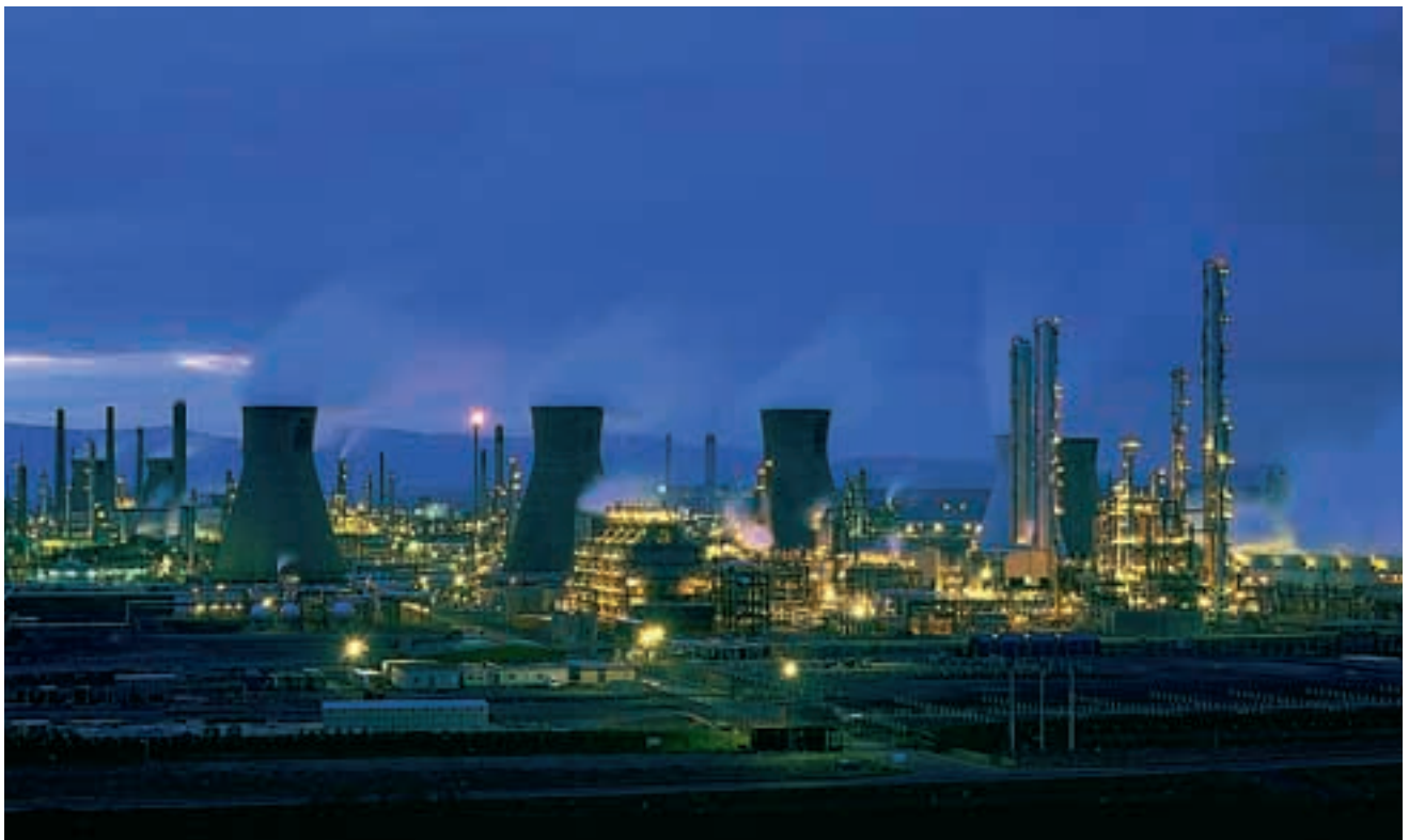
El jefe del Servicio de Prevención de la fábrica debe ser un titulado de carrera técnica superior con experiencia en el mundo del montaje, mantenimiento e ingeniería.

Es fundamental que en el clausulado de cada contrato de montaje o de