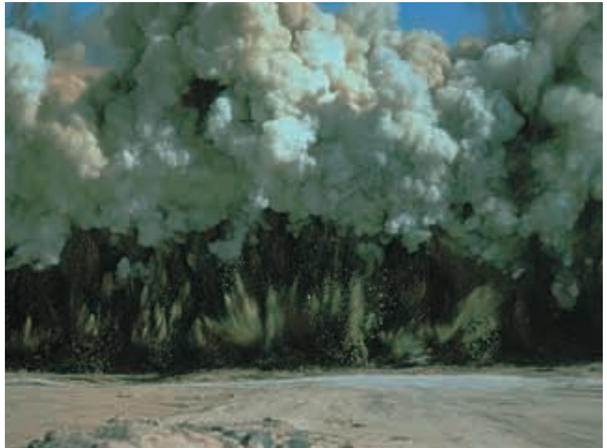
Durante la mayor parte de las obras la práctica totalidad de las especialidades técnicas coexisten: explotación de canteras, voladuras, movimiento de tierras, etc.

Al margen de otros aspectos, es frecuente que en este tipo de proyecto el personal que se encuentra desplazado en la obra sienta cierta indefensión e incluso abandono en el campo de las relaciones sociales, laborales y preventivas. Para subsanar estos y otros problemas se dotará al Servicio de Prevención de este gabinete jurídico, que asumirá no sólo la representación de todo el personal ante las autoridades, sino también la asesoría en materia preventiva e incluso la derivada de la responsabilidad civil y penal. Este órgano podría pertenecer al pro-