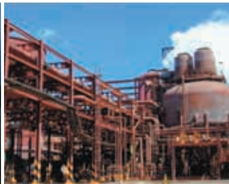
Ejemplos de instalaciones industriales de riesgo por usar componentes radiactivos (central nuclear) o reactivos tóxicos y corrosivos a grandes presiones (planta de producción de alúmina a partir de bauxita).