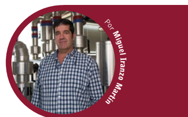
Por Miguel Irujo Martín

En el Real Decreto 393/2007 aparece delimitado el término "autoprotección". A lo largo de su articulado se desarrollan los mecanismos de control con los que cuentan las Administraciones Públicas, la gradación de las obligaciones de autoprotección y el carácter supletorio de este Real Decreto, respecto a la norma básica sectorial en aquellas actividades que, por su potencial peligrosidad y posibles efectos perjudiciales sobre la población y el medio ambiente, deben tener un tratamiento singular. La citada norma obliga a elaborar, implantar materialmente y mantener operativos los Planes de Autoprotección, determinando su contenido mínimo en aquellas actividades, centros, establecimientos, espacios, instalaciones y dependencias que, potencialmente, pueden generar situaciones de emergencia (o