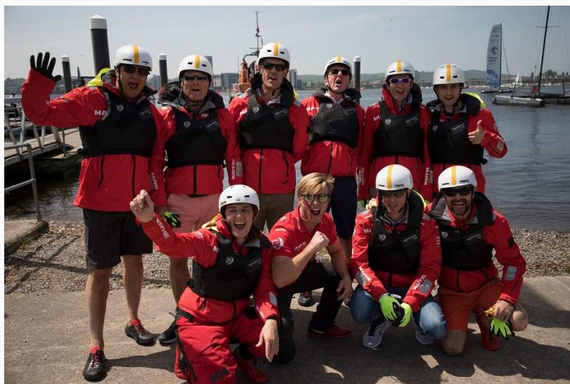
Cardiff stopover. M32 Guest Sailing Experience. 06 June, 2018.

El equipo español está más unido que nunca. Es un equipo comprometido de principio a fin en esta competición, en consonancia con los valores de nuestra compañía.