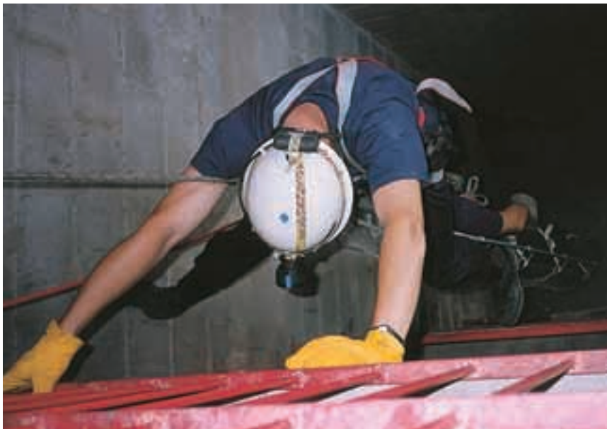
Hay prácticas que están destinadas a trabajar el control del estrés, simulando siniestros en lugares difíciles.

una fractura en las vértebras, pero es mejor prevenir. Ayúdanos y dínos si sientes alguna cosa.»