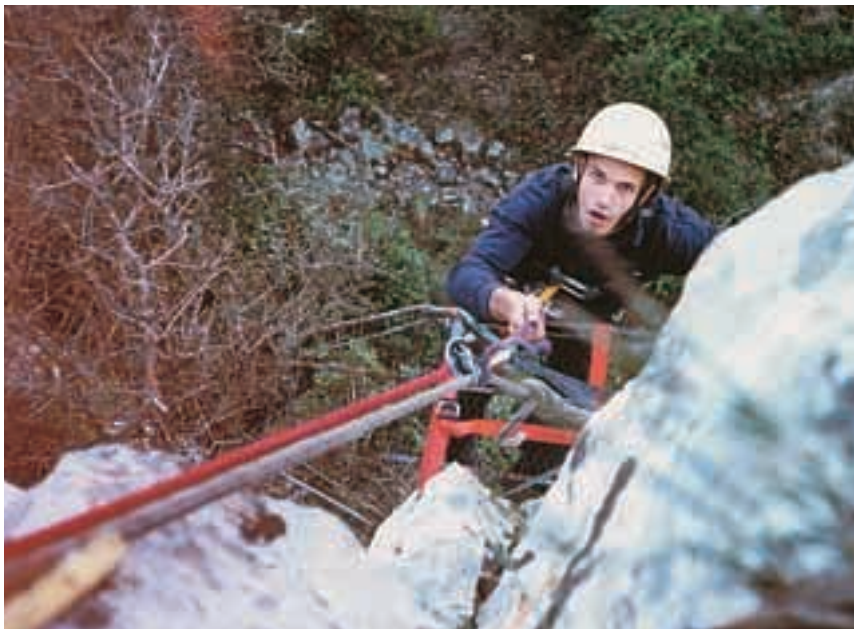
Durante los entrenamientos, el bombero puede poner en práctica las técnicas para controlar el estrés aprendidas en la formación básica.

Cuando participo en la formación básica de los nuevos bomberos suelo comentar que el deber de los mandos intermedios es contribuir a la felicidad del personal bajo su mando, cuestión que pasa ineludiblemente por conseguir que se conviertan en buenos profesionales. Cada día creo más en esta afirmación, a la que añadiría que el deber de los jefes y técnicos de los Servicios Contraincendios, seguramente pasa por contribuir a la felicidad de sus mandos intermedios, dotándonos de los medios necesarios para poder llevar a cabo nuestra misión con eficiencia.