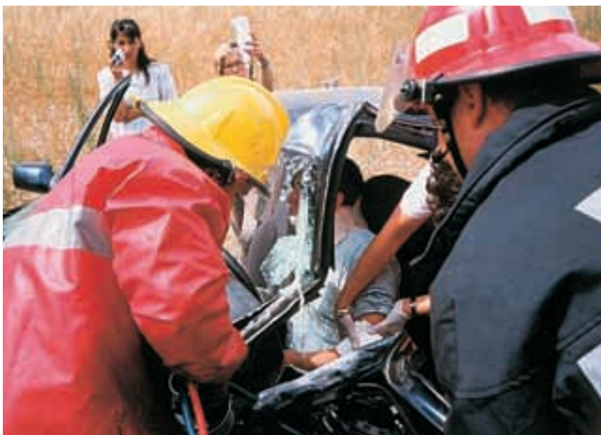
El trauma que sufren determinadas víctimas, aun cuando no tengan heridas físicas, no siempre es atendido correctamente, a pesar del sufrimiento que conlleva.

Uno de los aspectos más importantes de las intervenciones en las que se genera un ambiente altamente estresante son las reacciones del propio rescatador: