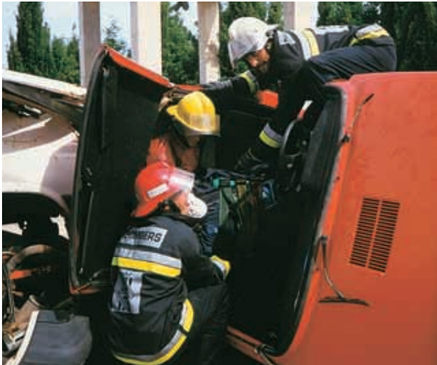
La preparación psicológica del bombero es un largo proceso que dura toda la vida.

no va a ejercer de médico, sino a evitar el agravamiento de lesiones. Se sobreentiende que ambas funciones, las propias del socorrista y los primeros auxilios psicológicos, pueden y deben concurrir en una misma figura, la del rescatador ya sea éste policía, bombero, socorrista, miembro de protección civil, etc.