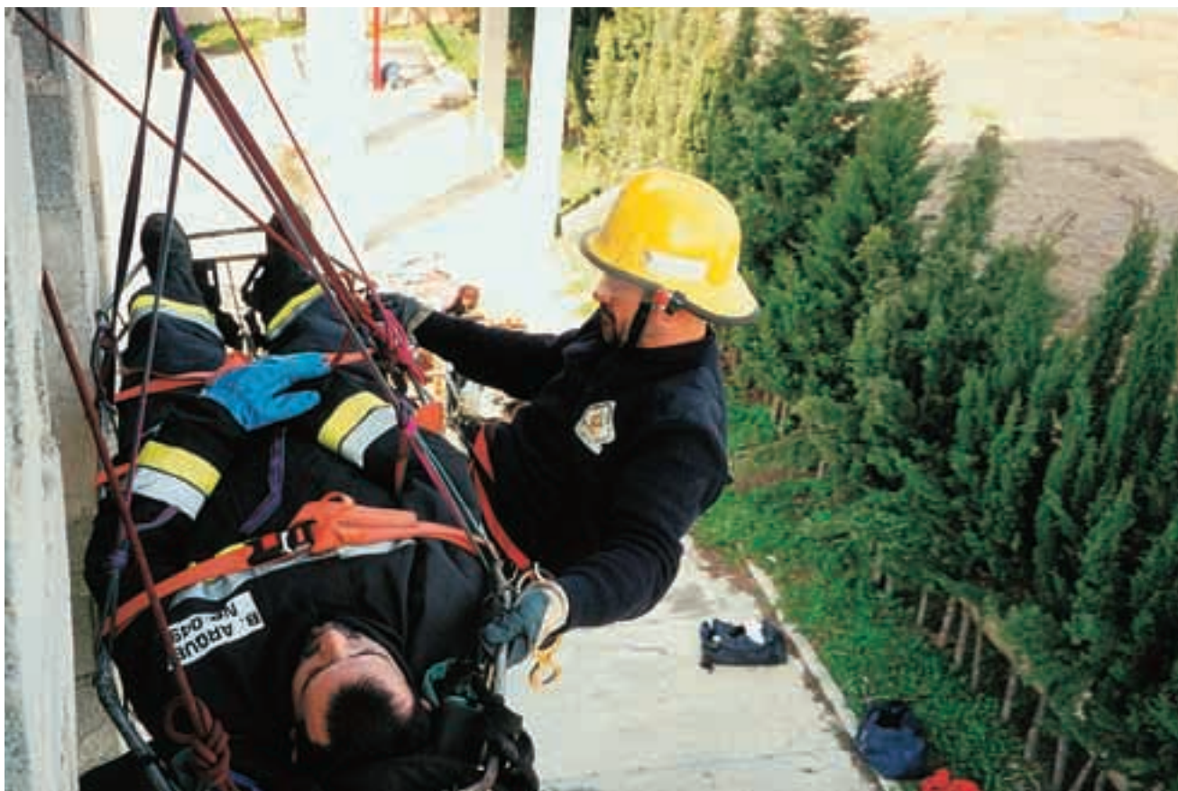
Un bombero ha de mantenerse constantemente entrenado para que su efectividad no disminuya.

1. Reacciones fisiológicas (taquicardia, sudoración...).