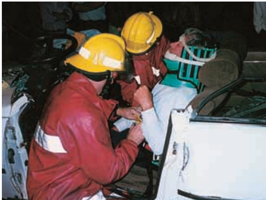
Los miembros de los equipos de rescate tienen más posibilidades de hacer frente a experiencias muy perturbadoras que la mayoría de las personas.

Históricamente, el EPT ha recibido diversos nombres: nostalgia (en la Guerra Civil), corazón de soldado, trauma psíquico, fisioneurosis, neurosis de ansiedad, agotamiento nervioso, síndrome de Da Costa, corazón irritable, síndrome del esfuerzo, aste-