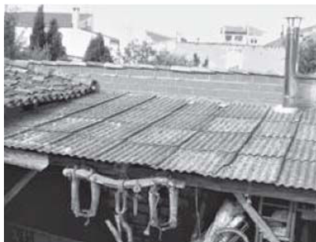
Figura 11 Cubierta de fibrocemento muy deteriorada