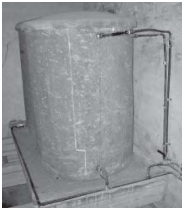
Figura 10 Conducto de aireación de fibrocemento