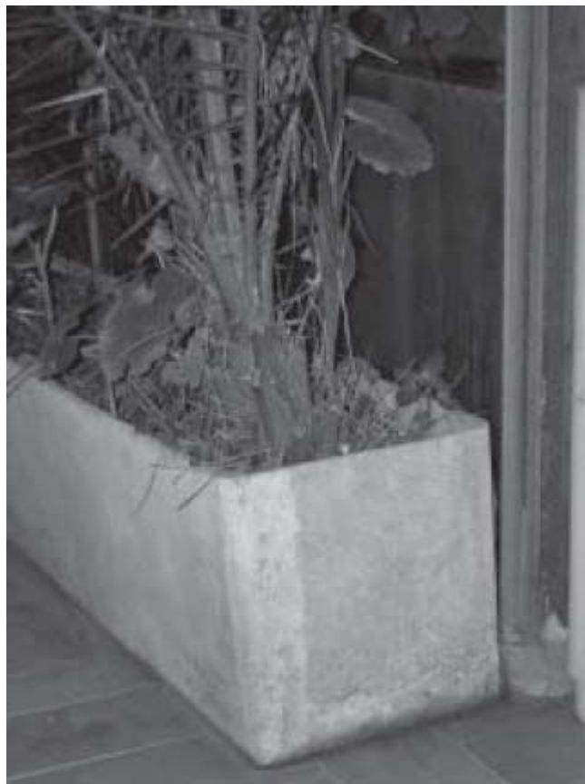
Figura 4 Exposición ambiental exterior; movimiento de tierras en vertedero incontrolado