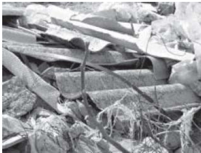
Figura 5 Exposición laboral: retirada placas fibrocemento