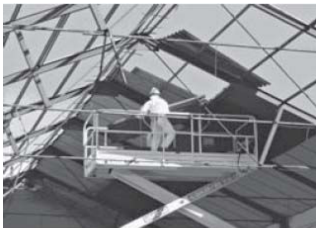
Figura 6 Placas de falso techo con contenido en amianto