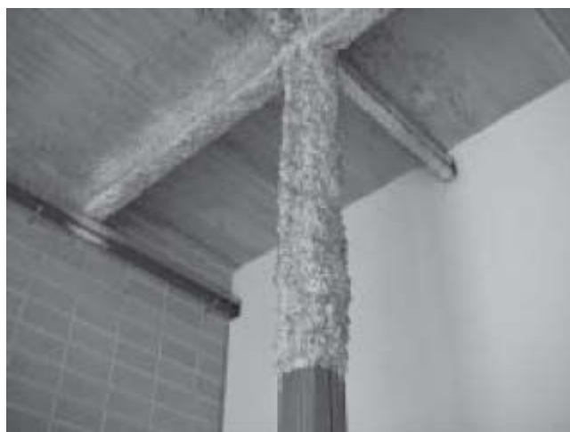
Figura 7 Flocage proyectado en estructura metálica