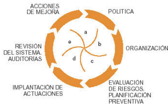
Figura 1 Elementos del Plan preventivo en un proceso de mejora continua

Respecto a la organización preventiva específica, son figuras clave, además de la del Delegado de Prevención y del Comité de Seguridad y Salud, cuando sea requerido, la del trabajador designado, si ésta es la modalidad de organización elegida o la del "coordinador de prevención", como se podría denominar, si la modalidad elegida es la de Servicio de Prevención Ajeno. En todo caso, se quiere destacar la importancia de quien a tiempo, normalmente compartido con su actividad laboral, ejerza funciones preventivas de promoción, coordinación y apoyo en este campo. Persona, que además de disponer como mínimo de una formación básica en prevención debería reunir una serie de condicionantes personales: competencia profesional con habilidades directivas, liderazgo, tiempo hábil para la acción preventiva, voluntariedad en la función y sensibilidad social.